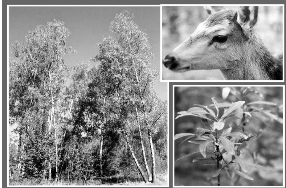
Для лесов вторая опасность после топора — огонь. В целях предотвращения лесных пожаров в области действует ряд профилактических мер — это разъяснительная работа, которая ведется с населением сел и городов, регулярно проводятся тактические учения с пожарными и т.д. В пожароопасные периоды мы вводим запрет на везение в хвойные леса.

Нам необходимо создать в области так называемый экологический каркас — посадить как можно больше деревьев, чтобы защитить население от вредного воздействия окружающей среды. Для этого нужно увеличить лесистость с девяти до 15 процентов. Работа ведется немалая, причем в ней участвуют жители сел и городов, в том числе школьники, студенты.