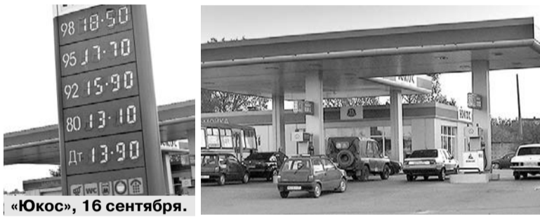
«Юкос», 16 сентября.

Пустые автозаправки и заоблачные цены на топливо уже разрушают целые отрасли мировой экономики. В четверг стало известно о банкротстве сразу двух крупнейших авиакомпаний США — Delta и Northwest.