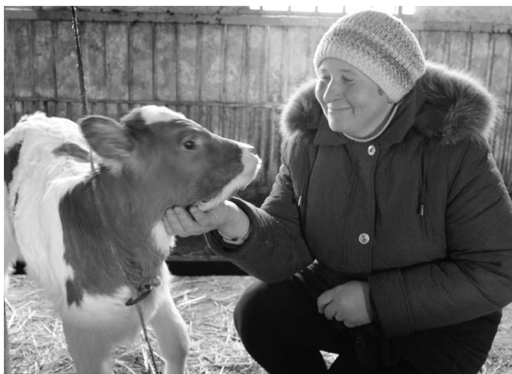
Животноводческие помещения ООО «Макеево», где содержится молочное поголовье и телата разных возрастов, выглядят по-хозяйски добротно, ухоженными. Еще сильнее последние морозы, и снежное покрывало плотно укрывает землю — первые зеленые всходы на ней появляются еще не скоро, а макеевским буренкам все равно: на фермах достаточно и сена, и зернофуража. В настоящее время начался массовый рост коров, соответственно значительно увеличился объем производства молока. Все сырье реализуется на Кромской маслозавод.

Живет нормальной полноценной жизнью. Я в свое время отучилась в Орловском сельскохозяйственном техникуме, много лет проработала в животноводстве. И если бы не наше хозяйство, которое дает нам работу, возможность заниматься любимым делом, тем, к чему мы привыкли, пришлось бы нелегко. Сельхозпредприятие своевременно рассчитывается с собственниками земельных долей, бесплатно предоставляет корма для животноводства работникам хозяйства.