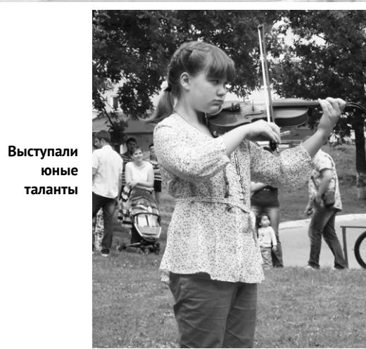
Выступали юные таланты