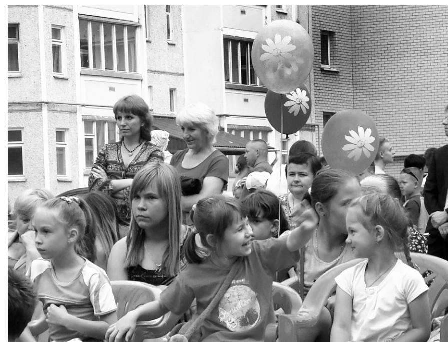
Не скукала детвора на празднике двора

«Много тёплых слов было адресовано супружеским парам, не один десяток лет живущим в любви и согласии, а также многодетным семьям, где воспитывают трёх и более детей.»