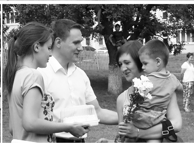
Сладкие подарки многодетным семьям