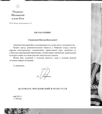
Патриарх Московский и всея Руси Кирилл

А что может быть ценнее, чем признание тех, кто сам прошёл огненными вёрстами Великой Отечественной? Максим БЕРЕЗИН