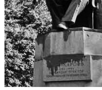
Памятник Н. Поликарпову в г. Орле