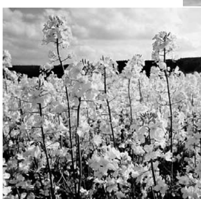
маслосемян за рубеж для производства биотоплива.

В настоящее время Орловская область занимает ведущее место в Российской Федерации по площадям посева и валовым сборам семян яровых сортов этой культуры. Достигнута рапсоводов ЗАО "Юность", ЗАО "Орел-Нобель-агро", ОАО "Орловские черноземы" и многих других широко известны в стране. В значительной степени благодаря результатам их труда загружены перерабатывающие мощности маслозаводов в Орле и Веневе (Тульская область).