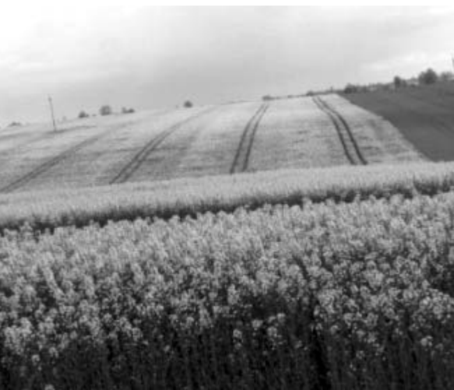
году достигал 38—42 центнеров с гектара.

Положительный опыт его возделывания уже имеется в ЗАО "СЕТ-Орел-инвест", ЗАО "Суворовское", ООО "Орловский лидер" и ряде других сельскохозяйственных организаций, где сбор маслосемян на отдельных полях в текущем