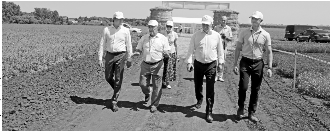
На полях ФНЦ ЗБК

В Федеральном научном центре зернобобовых и крупяных культур 23 июня состоялось пленарное заседание Международной научной конференции по вопросам развития АПК