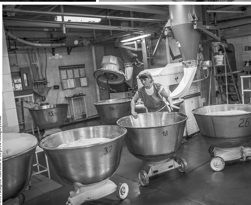
Хлеб выпекали пекари Орловского хлебокомбината

Мало кому известно, что во время блокады Ленинградским ботаническим ин-