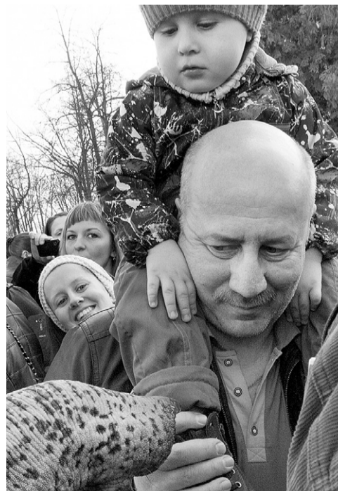
Известно, что слоны в диковинку у нас...

Артистки цирка выступают вместе почти 20 лет. Самой старшей из них 85 лет, са-