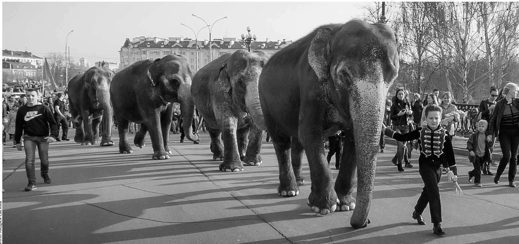
Слонохи шли по Ленинской, как по подиуму