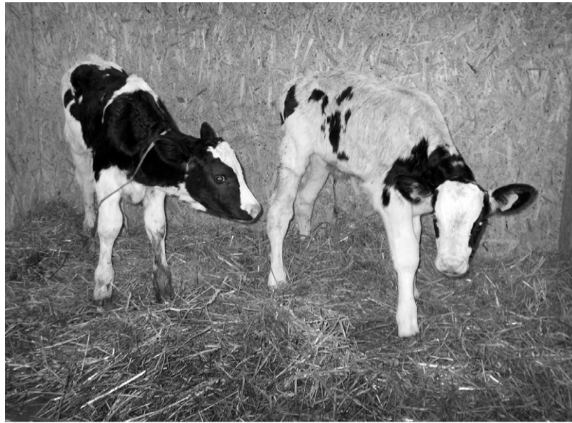
Тимоша и Рябчик выделяются особой статью

— За цену одной нетели можно купить четыре-пять