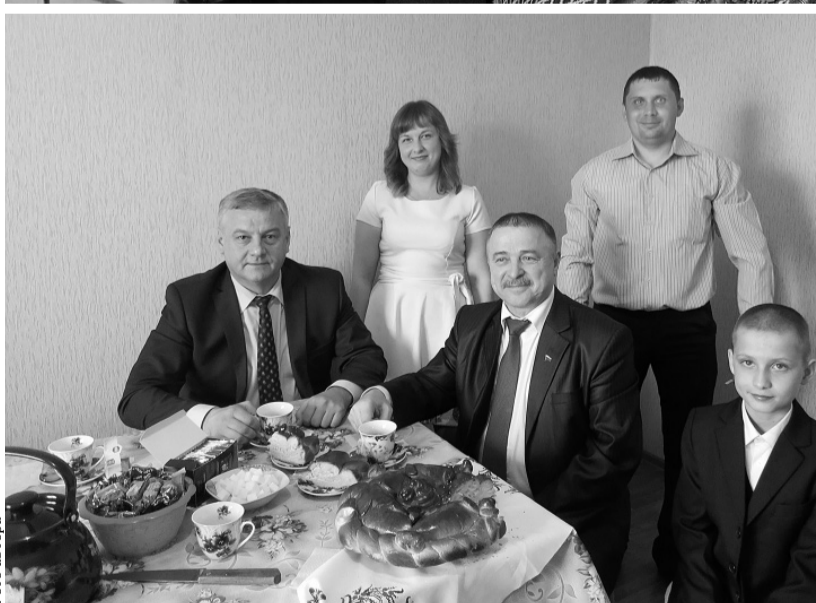
Почётные гости семьи Аверьяновых