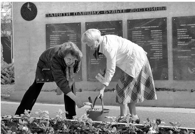
Матери погибших солдат каждую весну сажают здесь цветы