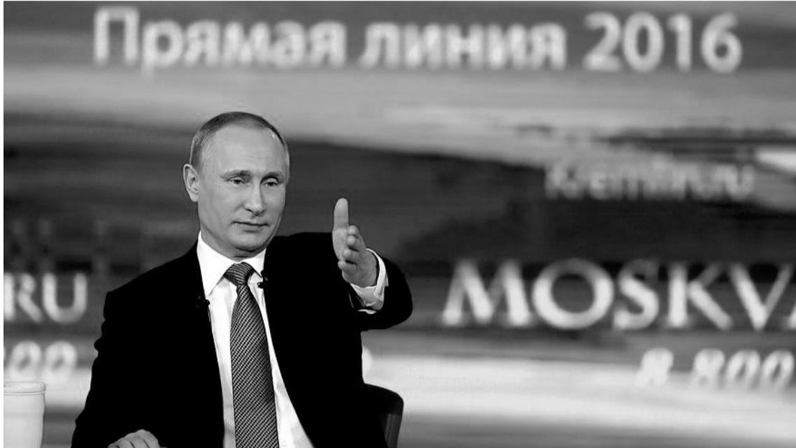
Владимир Путин: — Задавайте ваш вопрос

Чтобы снять остроту проблемы, часть средств, полученных от акцизов на моторное топливо, может быть направлена в дорожную отрасль. Также есть смысл в строительстве и обслуживании российских дорог перейти на контракты полного цикла, отметил президент.