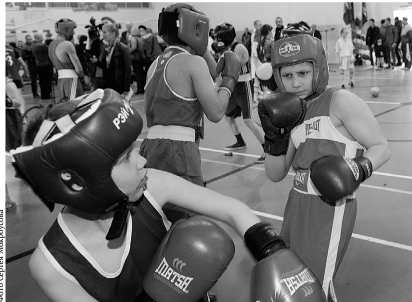
Юные боксёры готовились к приезду кумира

Экс-чемпион мира по боксу Николай Валуев поначалу едва мог пробиться к входу в спортзал — со всех сторон его теснили не только мальчишки, но и дамы солидного возраста. Надо отдать должное, Валуев никому не отказывал в автографе и фото на память. Мальчишки, заикаясь от радости, сжимали в руках вырванные из тетрадок листки с заветным автографом.