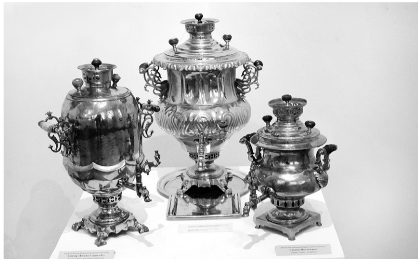
Шедевры XIX в.: самовары «Жёлудь», «Ваза ренессанс», «Ваза неогрек»