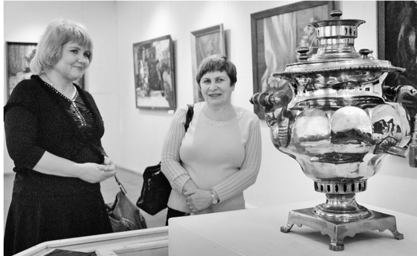
От такого самовара глаз не оторвать

На выставке в Орле можно увидеть потрясающие экземпляры. Например, самовар «Рюмка» первой половины XIX века известной фабрики Василия Баташёва. А рядом небольшой пузатый красавец — само-