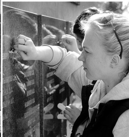
Имена павших воинов засияли на весеннем солнце