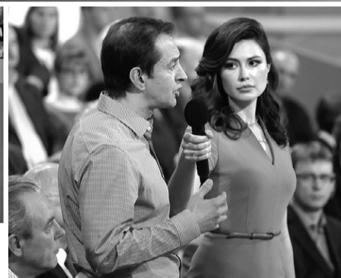
Актер Константин Хабенский попросил, чтобы не разлучали тяжелых детей с родителями в медучреждениях