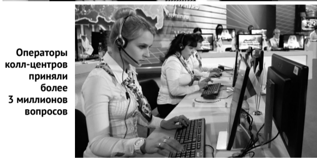
Операторы колл-центра приняли более 3 миллионов вопросов