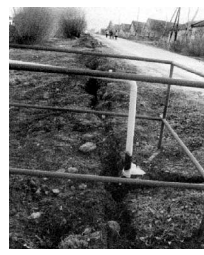
лился в бетонный почти трехметровый съезд к дому. Экскаватор елзизил из стороны в сторону, зло грыз дорожку — бесполезно.

На другой день так и не покорившую бетон бригаду перебрали на другой объект. Сюда газовики вернулись лишь 23 декабря. Опять долго и