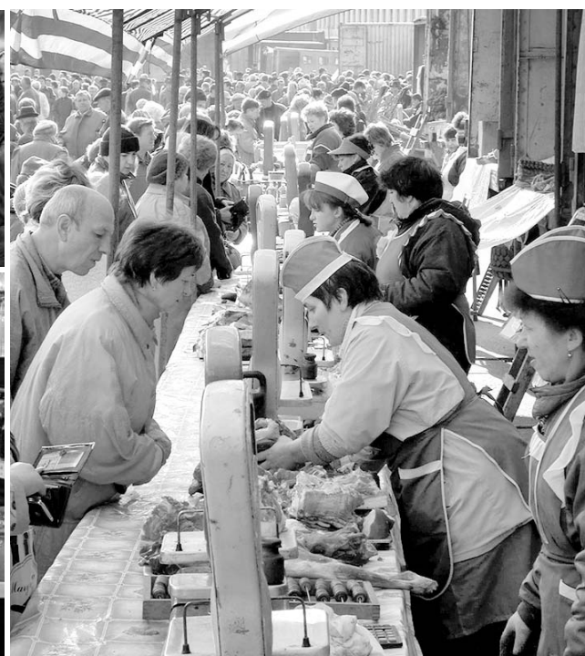
справилось со своей задачей, совет райпо стал принимать энергичные меры для возрождения этой важной отрасли.