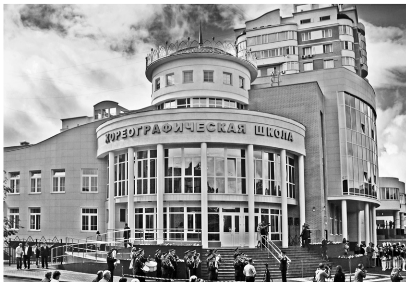
Детская хореографическая школа украсила Орёл