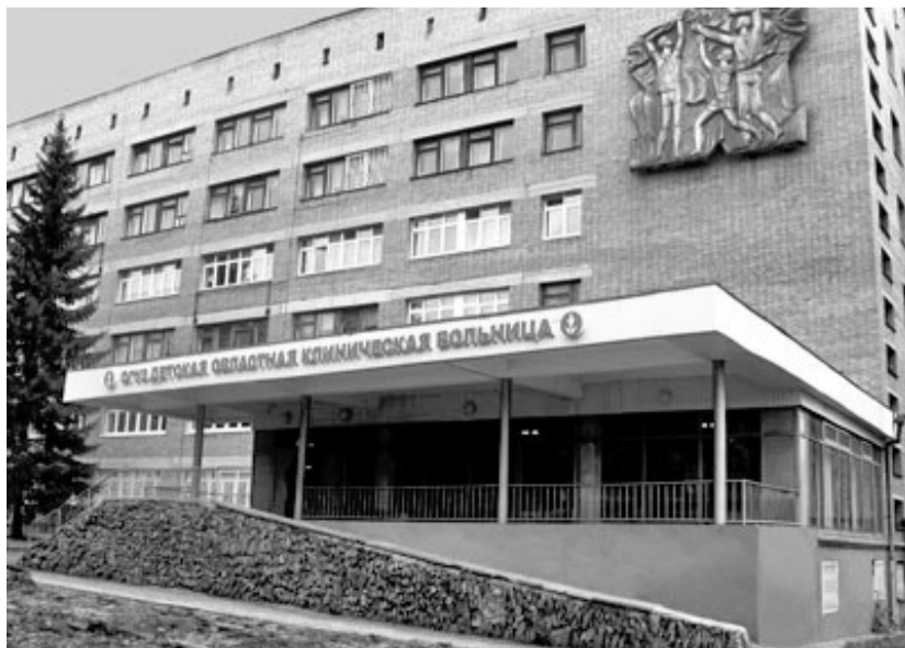
Здание детской областной клинической больницы

Детская клиника — это скорпомощная больница, которая работает 24 часа в сутки. Мы стараемся выполнять работу честно и профессионально, проявляя при этом неподдельную заботу о каждом маленьком пациенте. Ведь главная наша задача в том, чтобы дети Орловщины получали доступную и квалифицированную помощь.