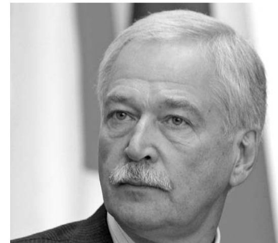
Борис Грызлов: — Средняя зарплата учителя не должна быть меньше средней по экономике в регионе

В начале октября Россия отмечает День учителя. Это повод еще раз поговорить о кадрах для современной российской школы. О том, какие решения уже приняты для повышения социального статуса учителя, и о том, что еще только предстоит сделать, рассказывает председатель Государственной думы Борис Грызлов: