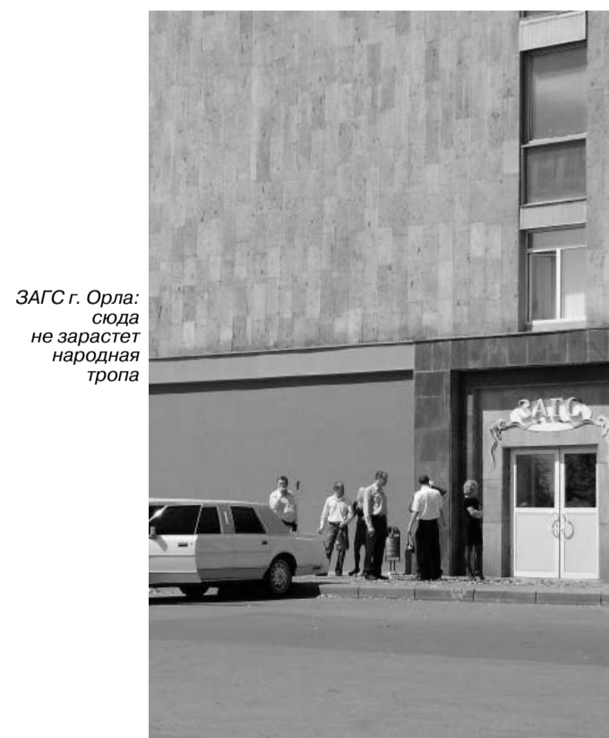
ЗАГС г. Орла: сюда не зарастет народная тропа