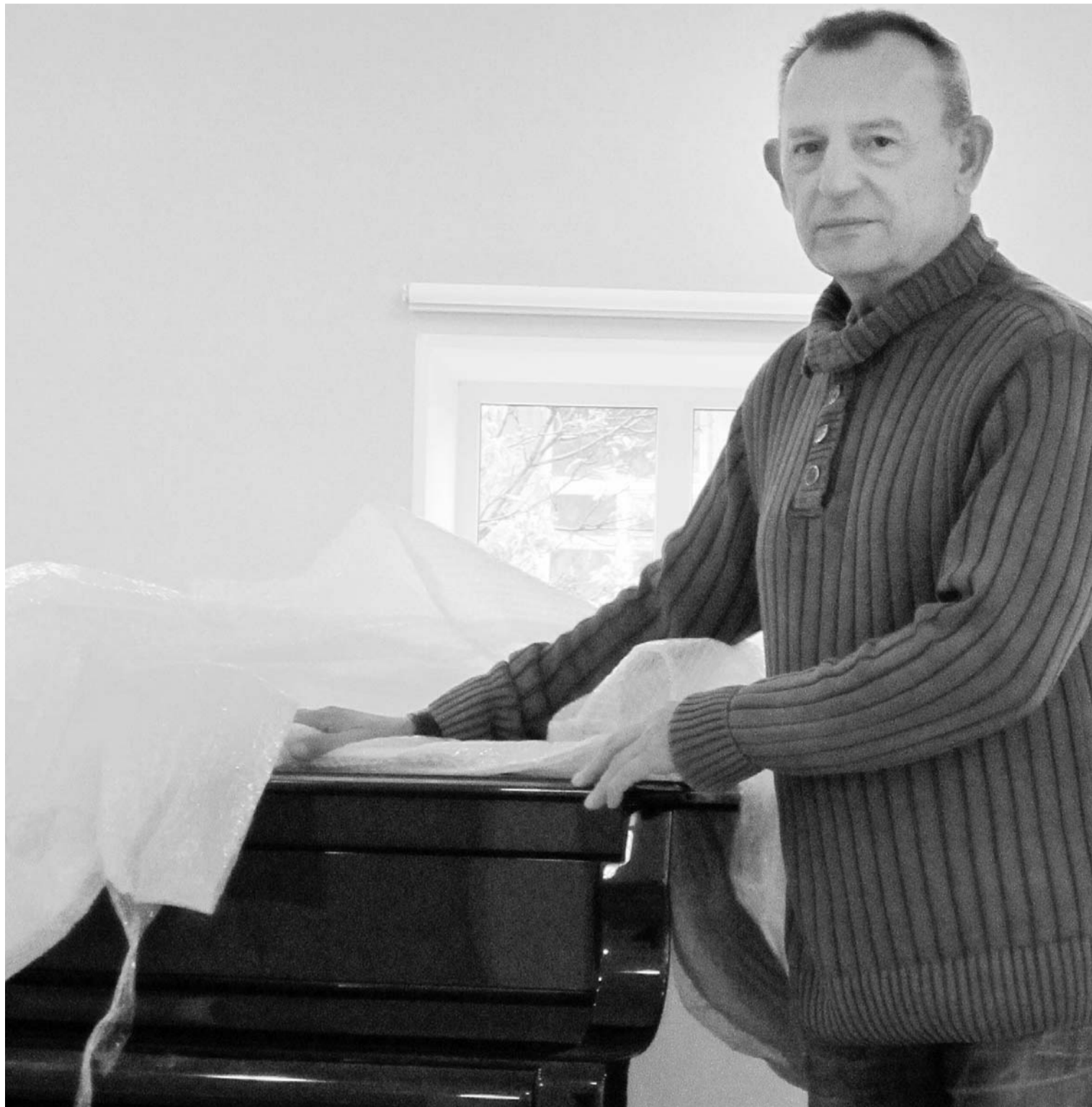
Для транс-портировки драгоценного рояля «Steinway» в концертный зал в Орел приехали специалисты из столицы

Во время ремонта испытали неудобства студенты, преподаватели и даже музыкальные инструменты — им пришлось переехать в другие помещения. Пару роялей приютили в мужском монастыре, а областное управление культуры выделило помещения для учебных классов в своем головном офисе. Студенты дудели и трубили и в других концах города (областной театр кукол, областной центр культуры, клуб завода шестерен).