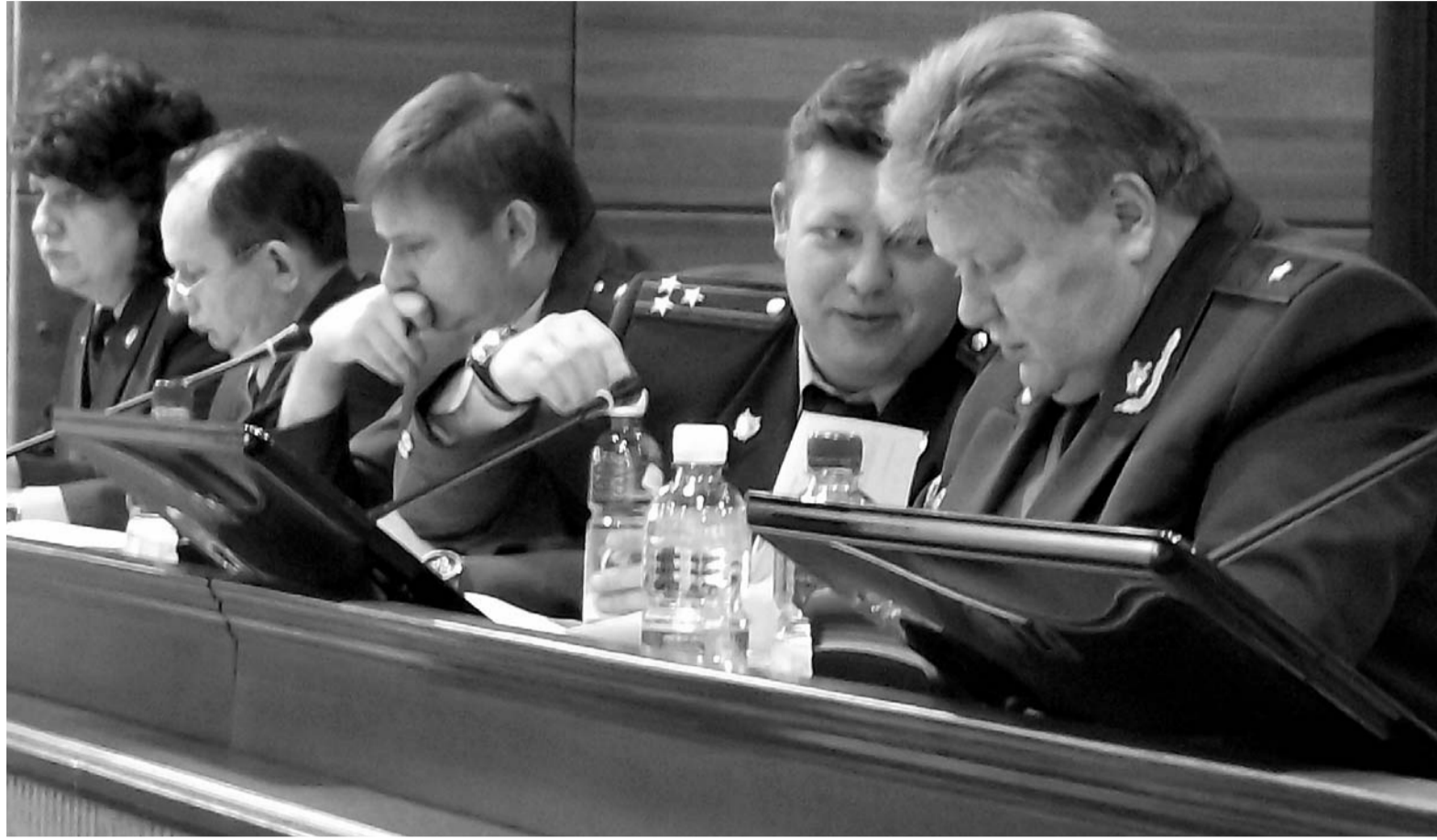
Космарить бизнес — не позволить роскошь

О чём речь? В первую очередь — об административных регламентах. С этого скучнейшего для читателя документа начинается дисциплина в деятельности местной власти. Это не расписание работы или график приёма посетителей, а чёткая регламентация чиновников в части «совать нос» в чужие дела.