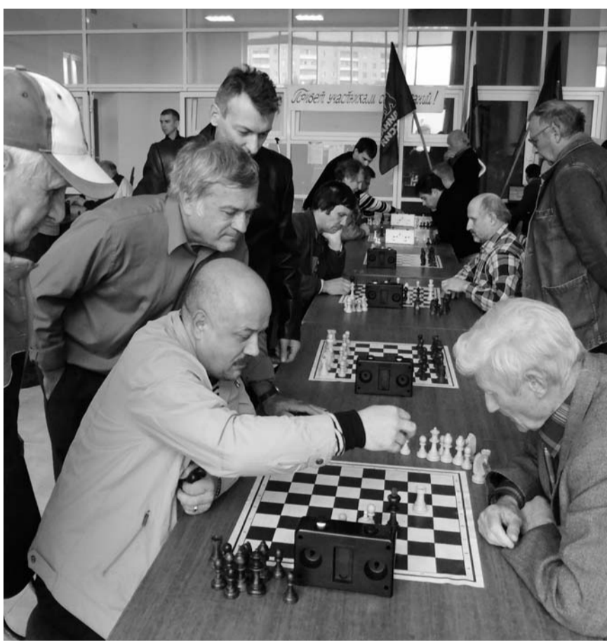
Главный приз — большой кубок для победителя — приготовил исполком партии «Единая Россия»