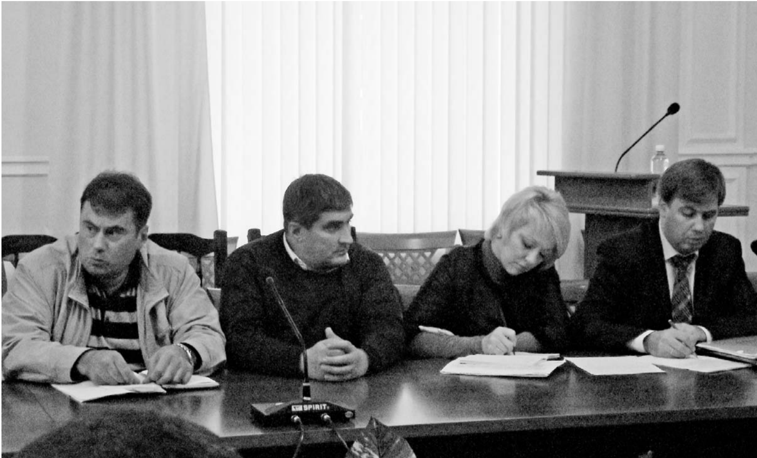
Переговоры с перевозчиками были непростыми

С ОКТЯБРЯ ДЛЯ СЕМИ КАТЕГОРИЙ ФЕДЕРАЛЬНЫХ ЛЬГОТНИКОВ ПРОЕЗД В МАРШРУТНЫХ АВТОБУСАХ ОРЛА БЕСПЛАТНЫЙ