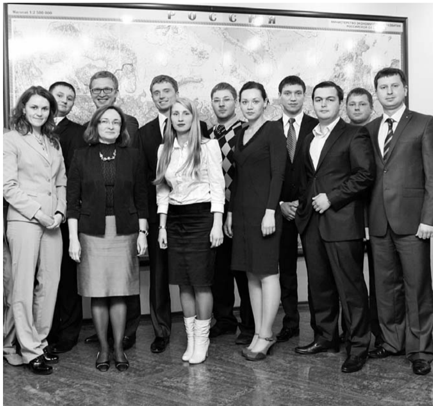
Министр экономического развития Э. Набиуллина: — Подобные встречи мы будем проводить регулярно

МИНИСТР ЭКОНОМИЧЕСКОГО РАЗВИТИЯ РФ ПОДДЕРЖАЛА ПРЕДЛОЖЕНИЕ МОЛОДЫХ ОРЛОВСКИХ БИЗНЕСМЕНОВ