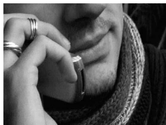
Мошенники звонят жертве и представляют родственниками или знакомыми, попавшими в ДТП