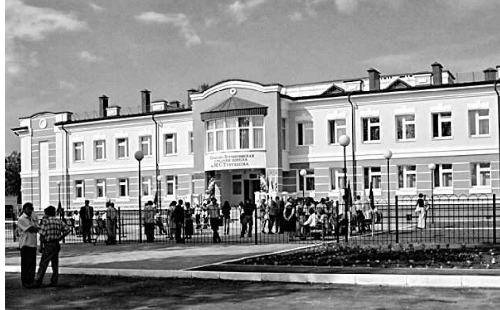
В 2011 году школа въехала в новое современное здание. На ее строительство было затрачено более 150 млн. рублей

Несмотря на то, что школа — частица тургеневского исторического наследия, юбилей получился скромным. Маленький актовый зал принял многочисленных гостей школы: депутатов областного и районного Советов, директоров нескольких школ района, пожелавших поздравить своих коллег с юбилеем, представителей администрации района. Гостей и старейших работников школы поздравили детские творческие коллективы школы и фольклорные группы взрослых и детей знаменитого Тургеневского народного хора.