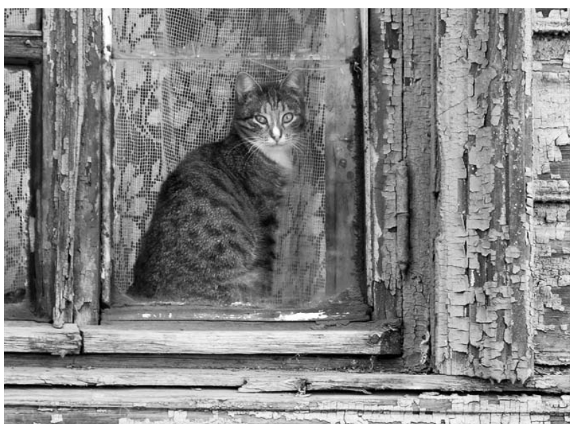
г. Орел.

Наш адрес: 302000, г. Орел, ул. Брестская, 6, к. 33.