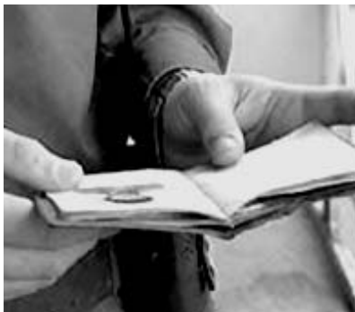
двадцати пяти минимальных размеров оплаты труда.

пребывания гражданина РФ, обязанного иметь удостоверение личности гражданина (паспорт), без удостоверения личности гражданина (паспорта) или по недействительному удостоверению личности гражданина (паспорту) либо без регистрации по месту жительства влечет наложение административного штрафа в размере от пятнадцати до