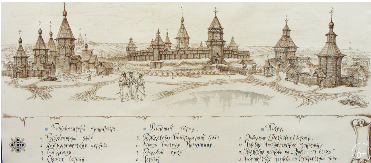
Орёл середины XVII века