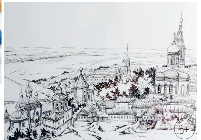
Старые Ливны. Вид на бывший Сергиев монастырь