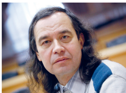
Окно в историю