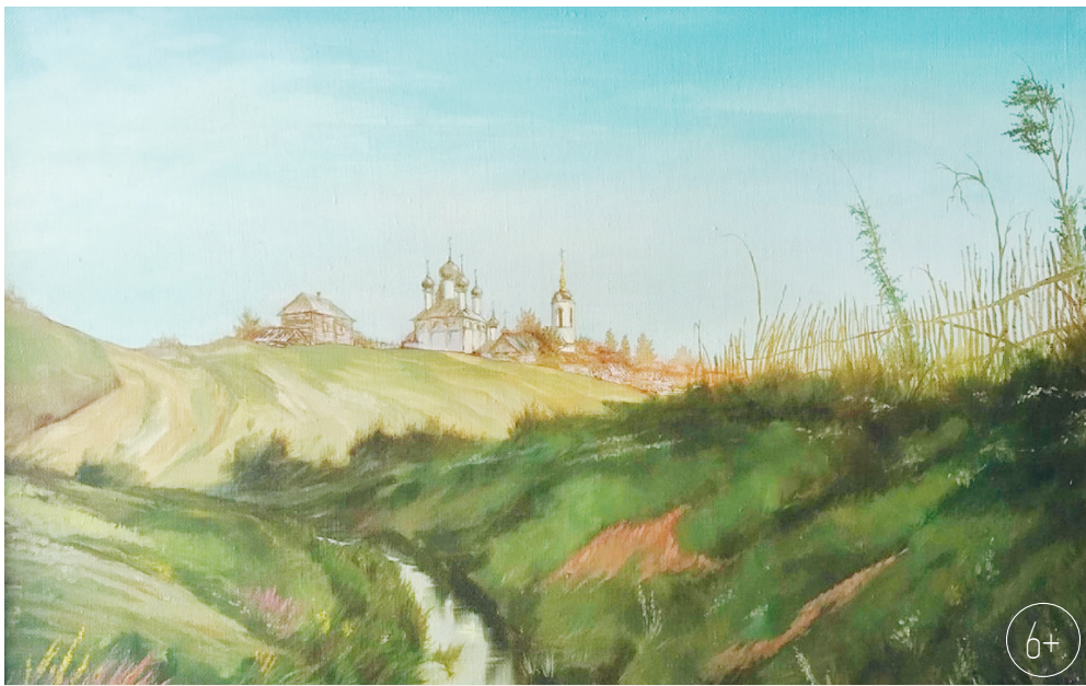
Вид на Петропавловскую церковь во Мценске со стороны реки Мцны