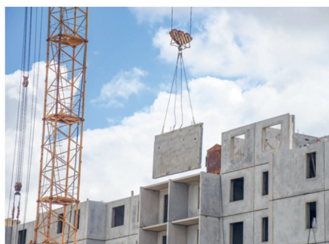
Новостройки улицы Садовой