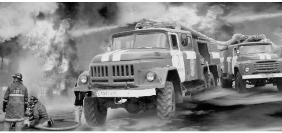
Коллаж Сергея Миронова.

— Здесь года три назад был прорыв водопровода, — пояснила она. — Раскопали место прорыва — и бросили. Зимой края ямы выметает снегом, а ведь мимо