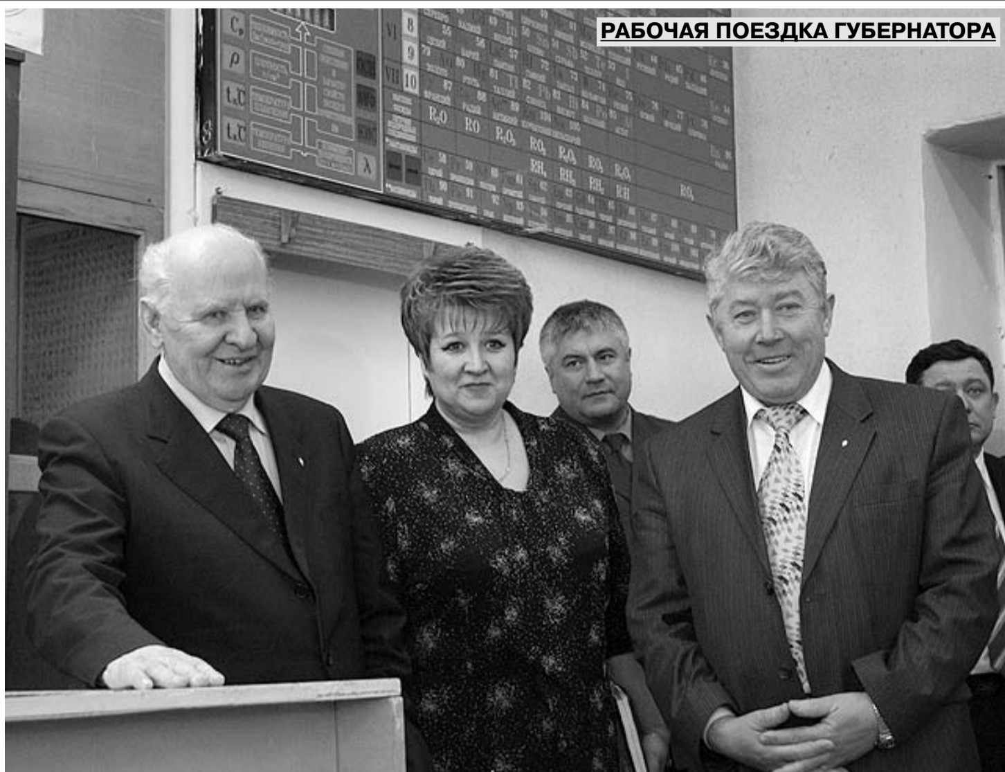
РАБОЧАЯ ПОЕЗДКА ГУБЕРНАТОРА