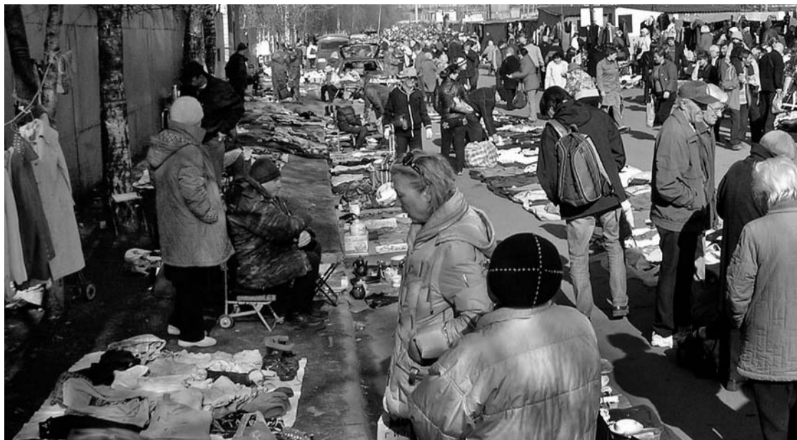
Пиршество частной торговли в советское время