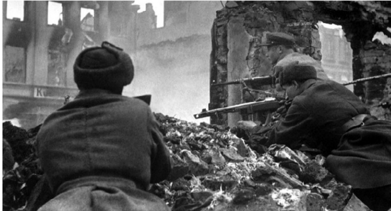
Битва за Берлин