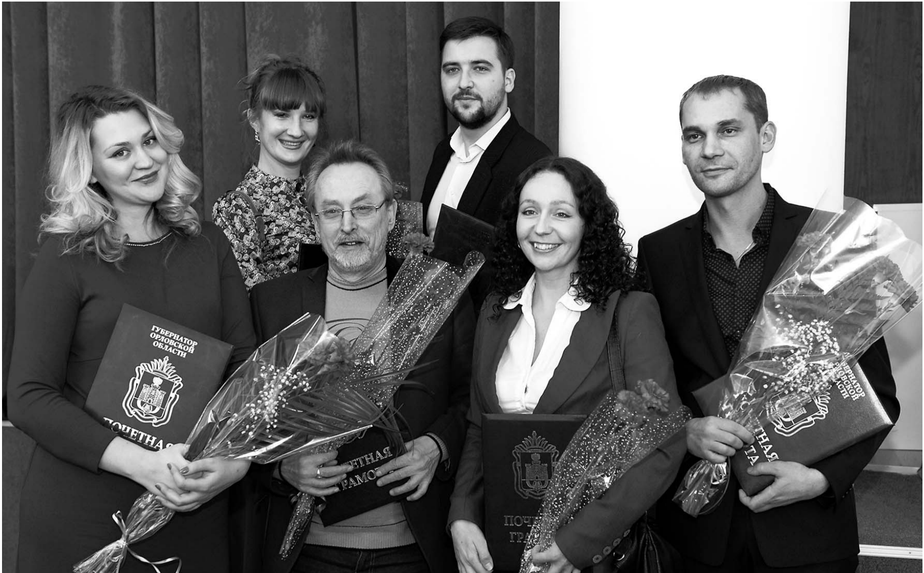
«Золотые перья» «Орловской правды»