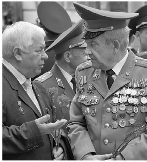
Ветераны вуза воспитали не одно поколение будущих стражей правопорядка