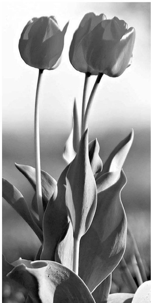
Юлия Кутарай: — Срезая тюльпаны, оставляйте на растении два листа, а после цветения удаляйте семенные коробочки

Часто тюльпаны страдают от фузариоза. Первые сим-