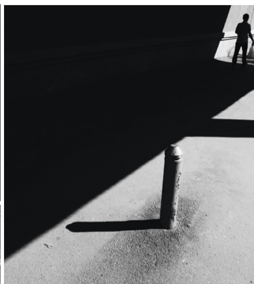
Максим Морозов. «Городская графика»