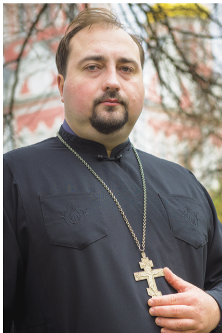
О. Олег: — Готовьте свои сердца к светлому празднику Пасхи

волизирует будущее второе пришествие Спасителя, когда Господь явится во всей своей славе и будет судить живых и мёртвых. Этот праздник для каждого из нас — наша встреча с Богом. Этот праздник завершает Святую Четырдесятницу, сорок дней поста, в течение которых мы готовимся к Страстной неделе. В этот день верующим разрешено вкушение рыбы и вина, которые запрещены во время Великого поста. Необходимо посетить в этот день Божественную литургию, по традиции освятить вербочки.