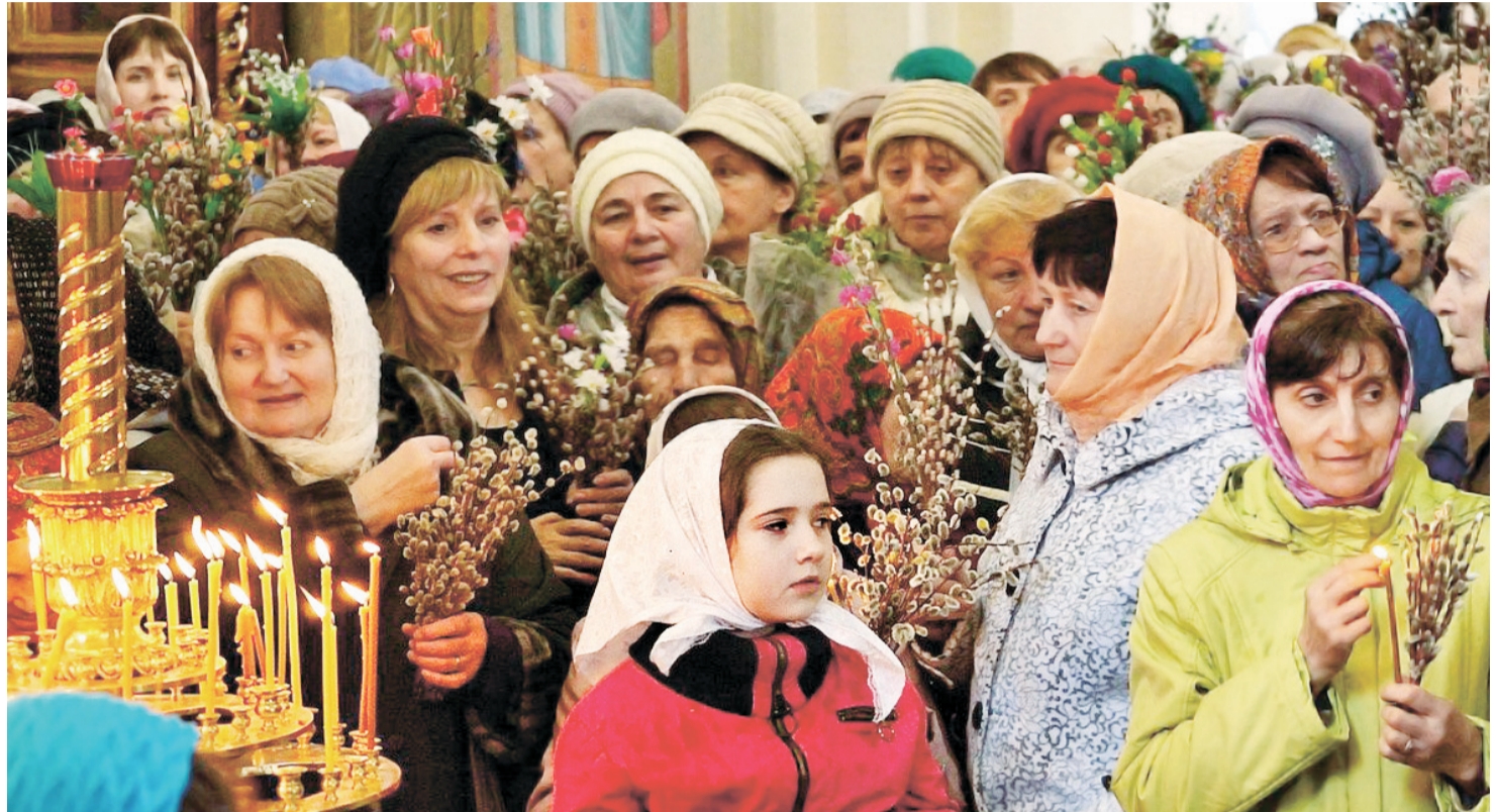
Освящённые вербочки надо хранить в течение года

В широком смысле Вербное воскресенье сим-