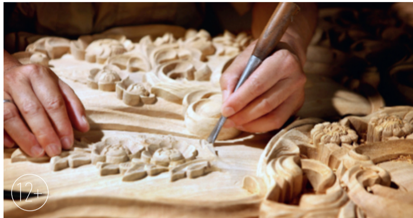
Резьба по дереву — настоящее искусство!

На выставке представлена литература по истории и технологии резьбы по дереву и выпилки. Посетители могут ознакомиться