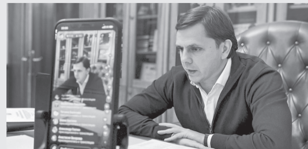
Главное из прямого эфира губернатора Орловской области Андрея Клычкова в социальных сетях за минувшую неделю.