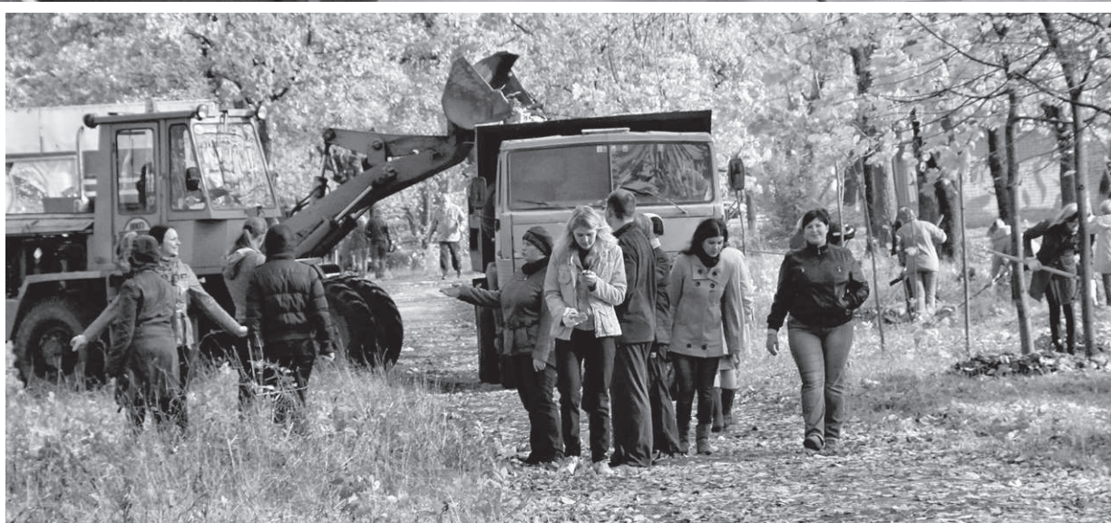
Губернатор Александр Козлов: — Приоритеты экологической безопасности помогут нам упорядочить работу по использованию богатств региона

Средства планируется направить на сбалансированное развитие сырьевой базы, обеспечение потребностей экономики Орловщины в минеральных и водных ресурсах. Подводя промежуточные итоги работы по обеспечению экологической безопасности, глава региона подчеркнул: «В прошлом году по результатам независимого экологического исследования общественной организации «Зеленый патруль» Орловщина заняла 10-е место по качеству окружающей среды в общероссийском рейтинге, поднявшись на 20 пунктов, и 3-е место по основным показателям в Центральной федеральной округе. А по итогам мониторинга эколого-энергетической эффективности, который в 2010 году — в начале 2011 года проводился Федеральной службой по надзо-