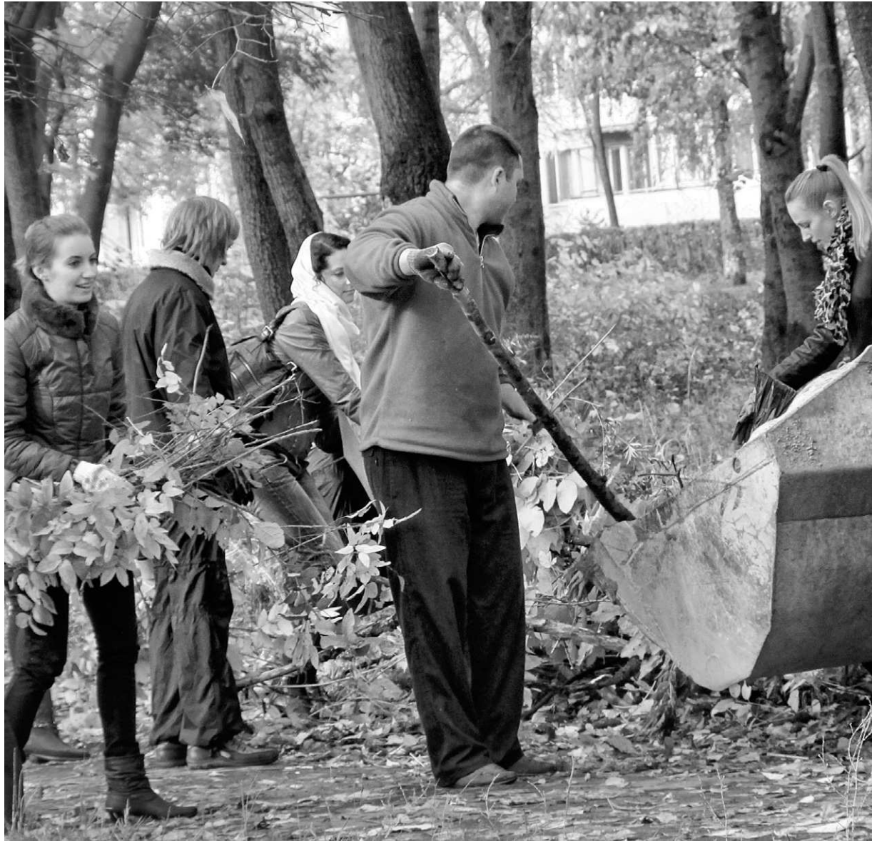
Работа на субботнике — помощь горожан нерадивым муниципальным службам

— Абсолютно. В том числе и территории общего пользования. Все они закреплены за управлением коммунального хозяйства. У муниципалитета с деньгами не всегда получается, но нужно понимать, что это ведь одна из важнейших задач. К примеру, обсуждался сот-