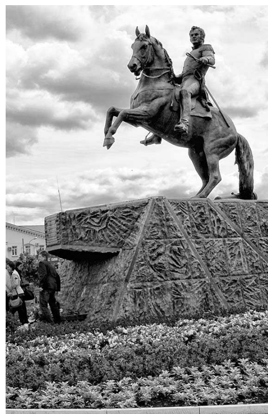
Памятник в Орле генералу Ермолову, который отличился в Бородинском сражении и под Ярославцем

К 10 часам вечера обе стороны прекратили артиллерийскую канонаду, хотя ружейная перестрелка продолжалась еще около часа. Ночью, однако, Астраханский гренадерский полк, находившийся на левом крыле, снова вступил в западную часть Малоярославца. Солдатам удалось смять французов и проникнуть в город, поджечь уцелевшие дома и «отступить почти без всякого урона».