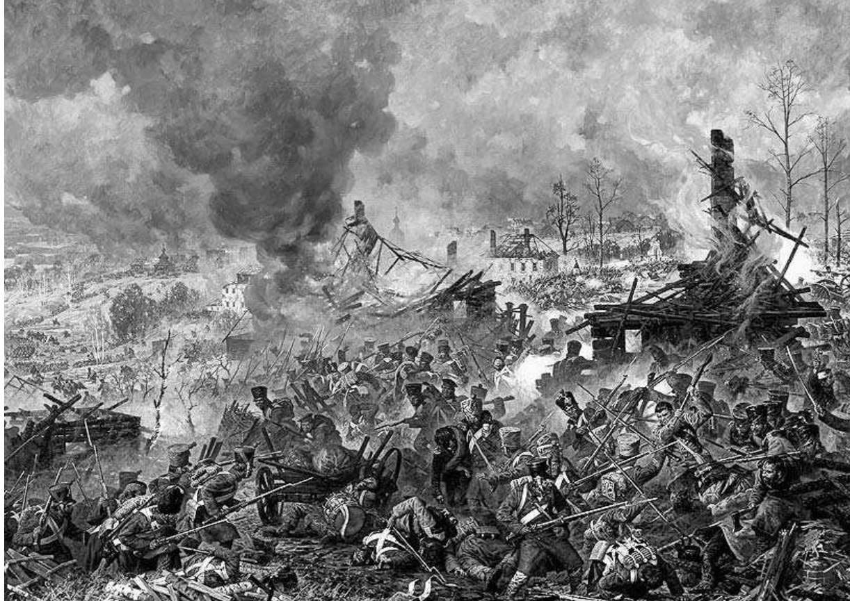
Сражение за Малоярославец отражено на картинах в музее Бородинской битвы

Сражение началось ночью. Оно длилось 18 часов, русские войска захватывали город не менее восьми раз, но французы, получая под-