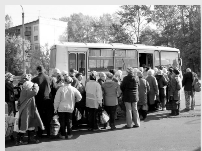
Маршрут № 69 Комсомольская площадь — дачный массив «Кораблики»