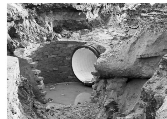
Злосчастный коллектор слишком дорого обошелся орловцам

Питерский «Гаджет» в очередной раз не вложился в сроки сдачи городского коллектора, и администрация Орла отказалась от услуг питерского подрядчика.