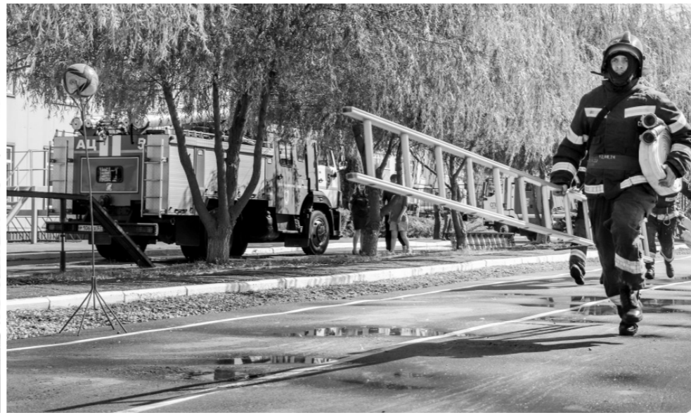
Слаженная командная работа