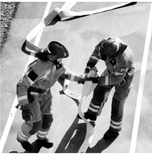
Три минуты хватало победителю соревнований — команде СПСЧ справиться с заданиями

команда СПСЧ, второе место заняли огнеборцы ПСЧ № 2, третье — ПСЧ № 5. Нам потребовалось на выполнение конкурсной задачи около трёх минут — это отличный результат, — рассказал начальник дежурной смены СПСЧ Дмитрий