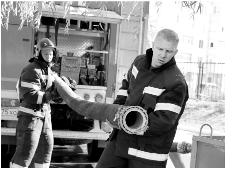
Счёт идёт на секунды