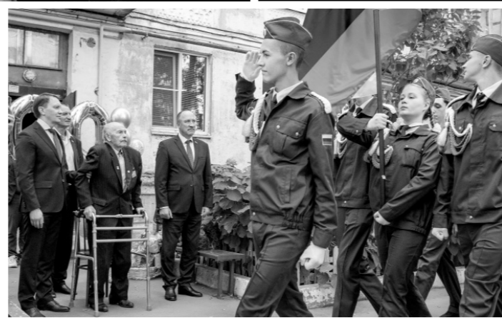
Парад в честь фронтвика