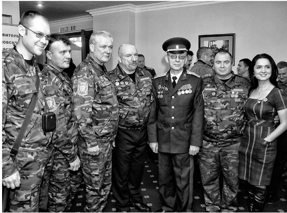
Члены поисковых отрядов подвели итоги работы

Молодежь, которая активно участвует в жизни региона, была отмечена почетными грамотами губернатора и областного Совета. Особые слова благодарности Александр Козлов высказал членам поисковых отрядов за их важную работу по сохранению памяти и увековечению имен по-