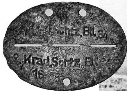
Немецкий похоронный жетон