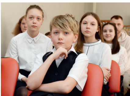
Космос — это мы!

ных странах мира — всего было 27 визитов.