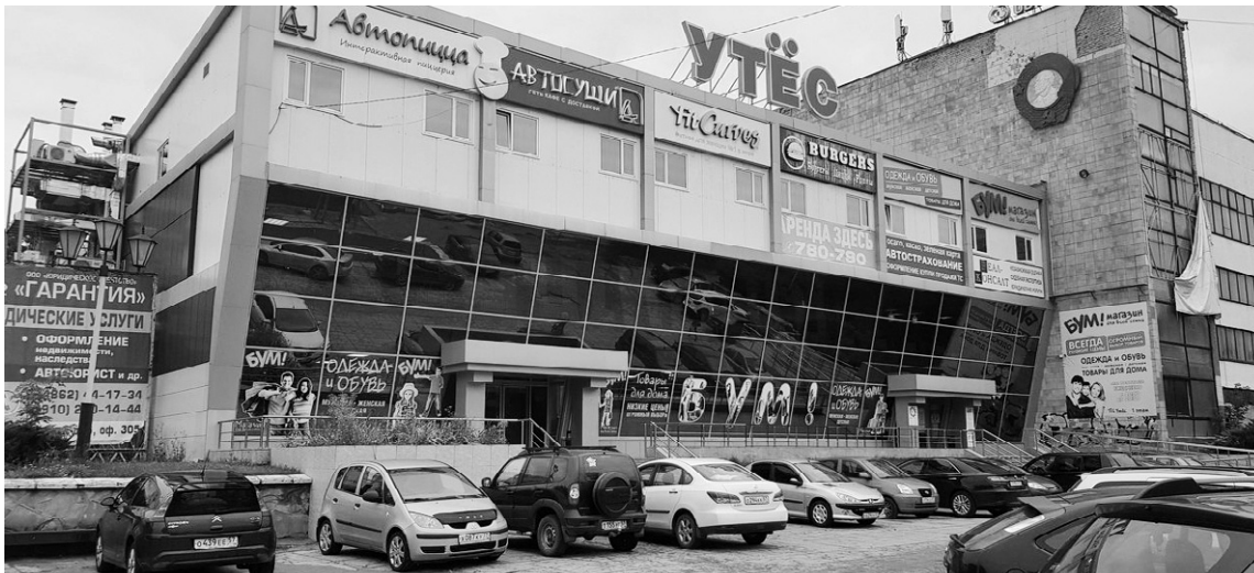
Былые промышленные флагманы превращены в гипермаркеты и скопления бутиков

Согласно законопроекту в качестве налогооблагаемой базы будет установлена кадастровая оценка отдельных видов имущества — принципиальные позиции будущего закона уже одобрены и приняты в первом чтении Орловским областным Советом народных депутатов. Законопроект прошёл большой путь от плана мероприятий (дорожной карты) «Переход к введению налога на имущество юридических лиц, налоговая база которого определяется как кадастровая стоимость имущества, в отношении отдельных видов недвижимого имущества, признаваемого объектом налогообложения», утверждённого распоряжением правительства Орловской области от 23 января 2015 г. № 16-р, до обсуждения и слушания депутатами. Как любой законодательный акт, в котором фигурируют изменения в налоговой сфере, он вызывает вопросы у общественности и бизнеса, на которые мы постараемся ответить в этой статье.