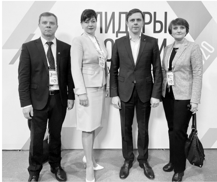
Андрей Клычков с полуфиналистами конкурса «Лидеры России-2020» от Орловской области

Перспективные управленцы Орловщины могут заявить о себе на всю страну, приняв участие в престижном конкурсе «Лидеры России»