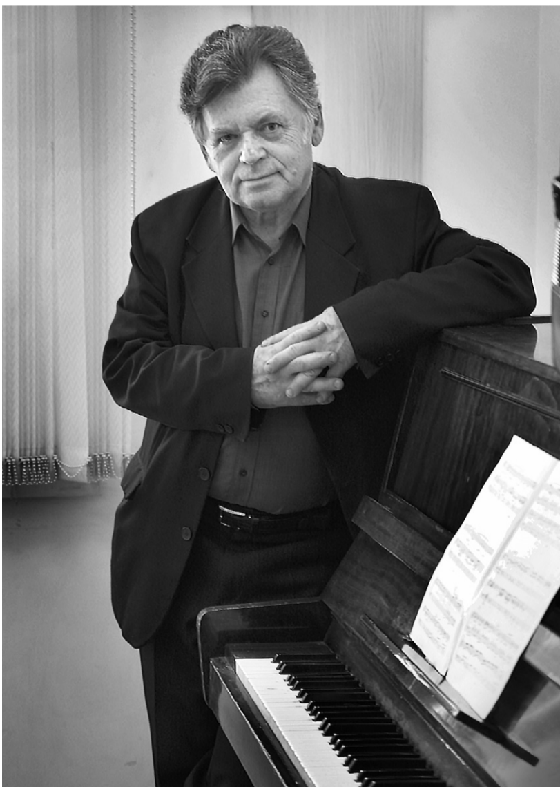
Евгений Дербенко: — Опера — это искусство, предназначенное для широких масс, для народа, а не для элиты

« Маэстро Дербенко сегодня показывает, что народной музыке подвластны любые высоты. »