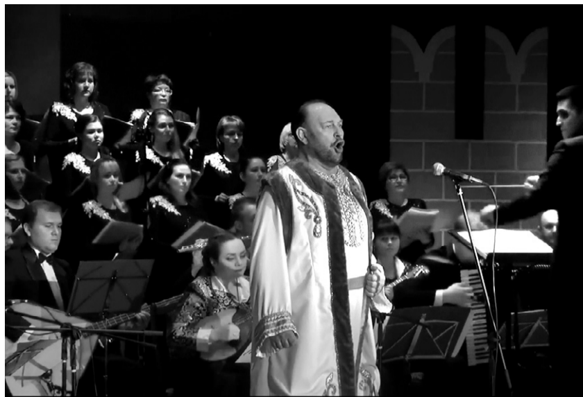
Главные партии в опере исполнили солисты Ступинской филармонии