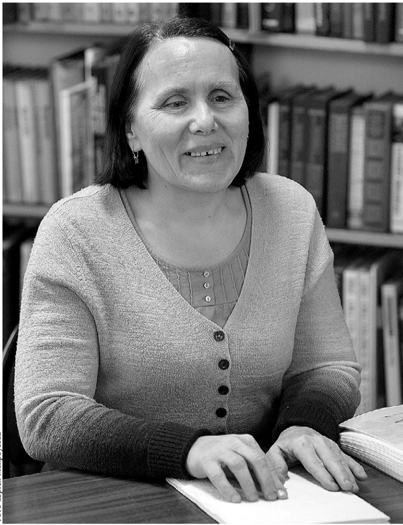
Кончиками пальцев прочитаны тома

Прозвучали также стихи «Отчий дом», «Тёмные его аллеи» (посвящённое И. Бу-