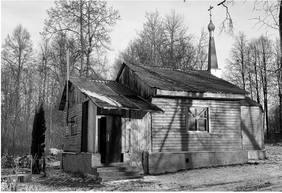
С приходом батюшки Георгия это святое место стало оживать!

Несмотря на то что к селу Спас-Чекряк практически нет дороги, это место постепенно превращается в духовный центр орловского края, возвращает себе былую славу, становится, как прежде, святыней Орловщины.