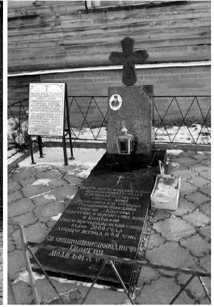
«На сем месте находился храм Преображения Господня и почивали под спудом святые мощи подвижника и чудотворца священноисповедника Георгия (Коссова)»