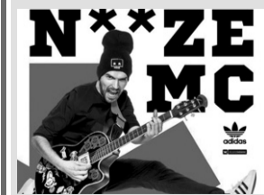
Когда: 10 декабря, 19.00. Где: «ЧА:СЫ club». Стоимость: от 800 руб.

Получить море драйва, заряд положительных эмоций, вдоволь наглядеться на ребят, которые настолько полюбили огромному количеству людей, даже тех, которые ни рэп, ни рок не слушают, можно. Для этого нужно только купить билеты на концерт «Noize MC».