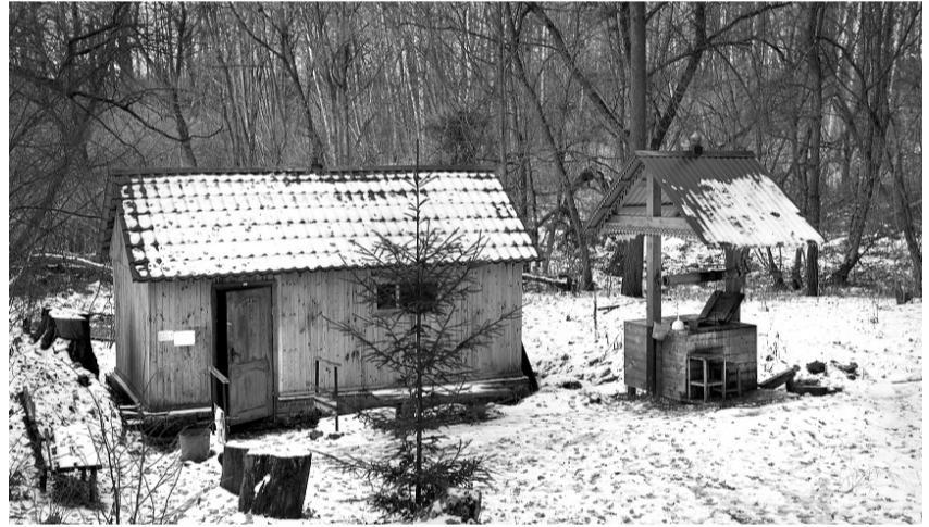
Лишь умывшись водой из святого источника, многие люди получают помощь и облегчение