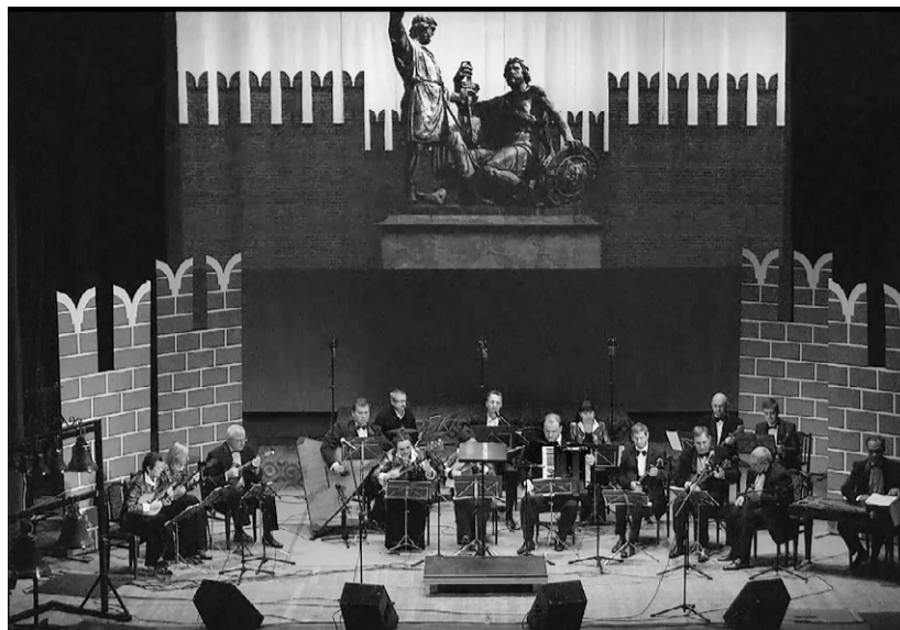
Успех автора разделил оркестр русских народных инструментов «Мелодии России»