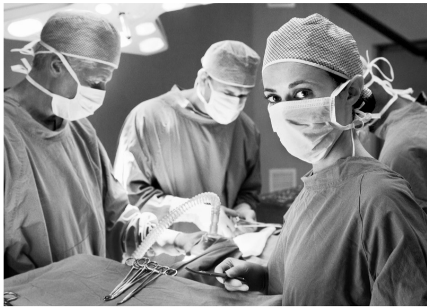
Высокие технологии орловским врачам по плечу

держивать лечебные учреждения на селе, существовал так называемый сельский коэффициент, который позволял при неполной загрузке работать и обеспечивать доступность медпомощи.