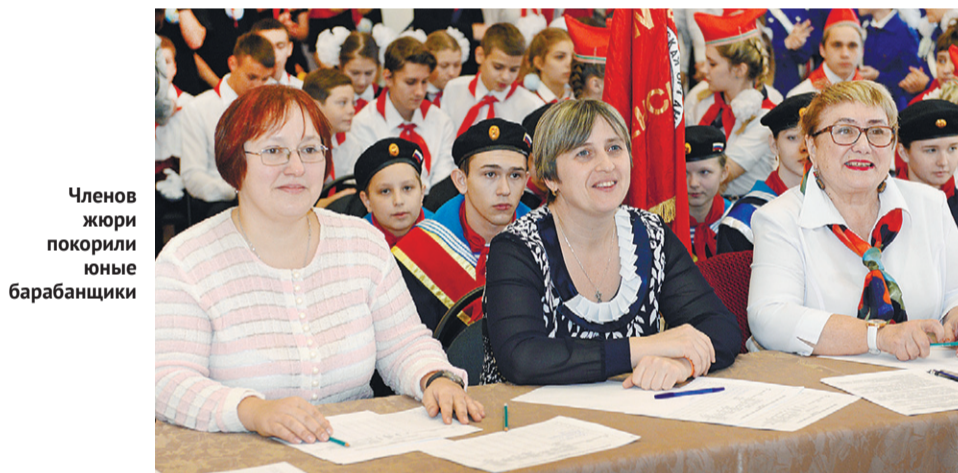
Членов жюри покорили юные барабанщики

участвовали 12 знамённых групп и девять отрядов барабанщиков.