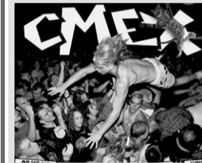
Когда: 2 декабря, 19.00. Где: концертный зал «Герц». Стоимость: 400 руб.

Эти ребята никогда не пытались быть в свежей и модной струе для того, чтобы быть популярными наряду с более поповыми командами. Они никогда не пытались измениться под давлением общества. Группа «СМЕХ» каждым своим альбомом доказывает преданность стилю, отвагу в заявлениях и мастерство в исполнении. Новый альбом не будет исключением, а, наоборот, станет продолжением истории группы. 12 разносторонних боевиков не разрешат вам нажать на паузу, а после неоднократного прослушивания в ваших головах ещё долго будут звучать припевы новых песен! Только «СМЕХ» умеет так изящно, стильно и весело доносить до слушателя по-настоящему правдивые истины грешного бытия, любви и существования в этом мире.