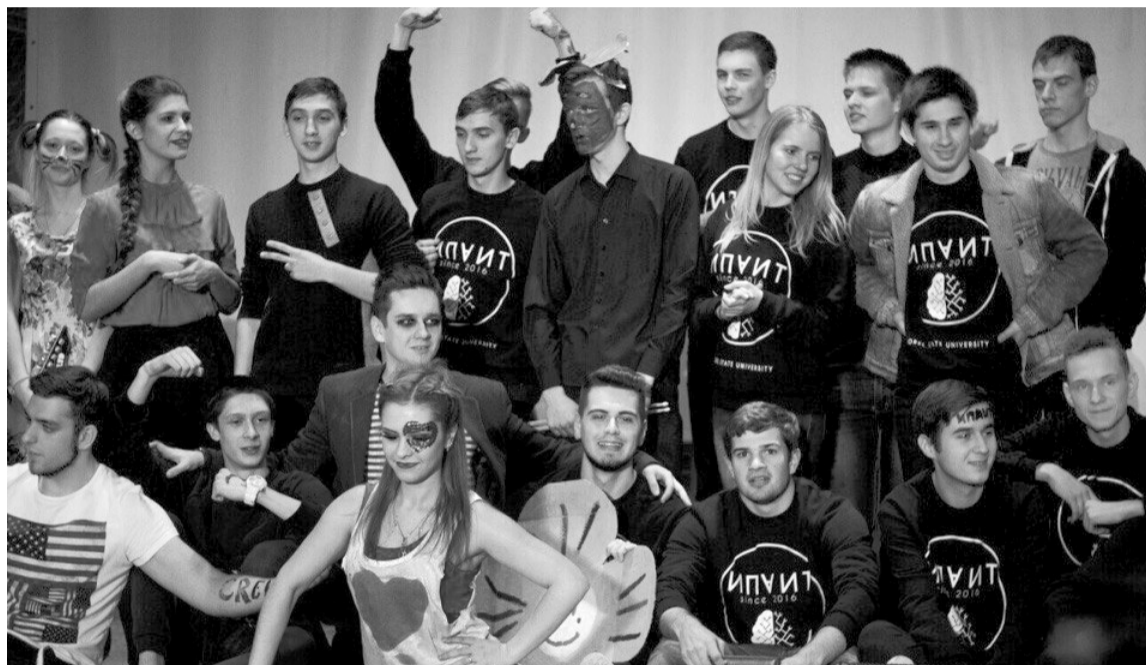
Дельфы запомнятся надолго их участникам

меров было очень много. И лучшие из них жюри фестиваля отобрало для финального гала-концерта.