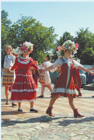
ДЕНЬ «АЗБУЧНЫХ ИСТИН»