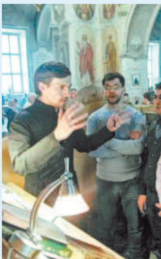
БЛАГОСЛОВЛЯЙ, ДУША МОЯ...