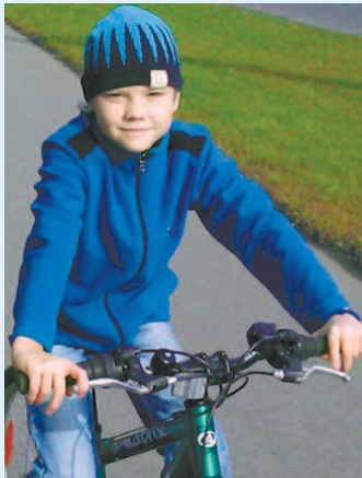
ОРЛОВСКИЕ МЕДИКИ СПАСЛИ ПИТЕРСКОГО МАЛЬЧИКА