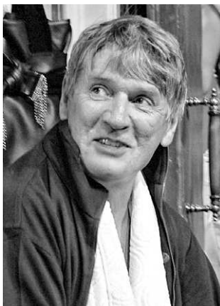
Народный артист России Александр Абдулов.

лище подал документы лишь по просьбе отца. Но не поступил. И стал студентом спортивного факультета педагогического института. В свободное время спешил к отцу в Ферганский театр... И так втянулся в профессию, что уже через год без труда поступил в ГИТИС. В выпускном спектакле его заметил художественный руководитель театра «Ленком» Марк Захаров