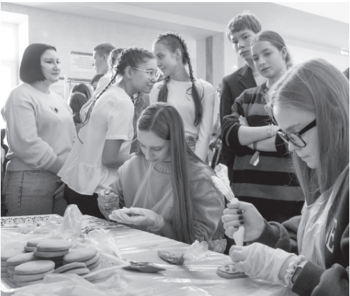
Любой желающий мог расписать пряник в цвета российского триколора

лодёжи. — Сегодня Россия вновь ведёт священную борьбу за мир и безопасность. В это непростое время мы объединились для общей победы.