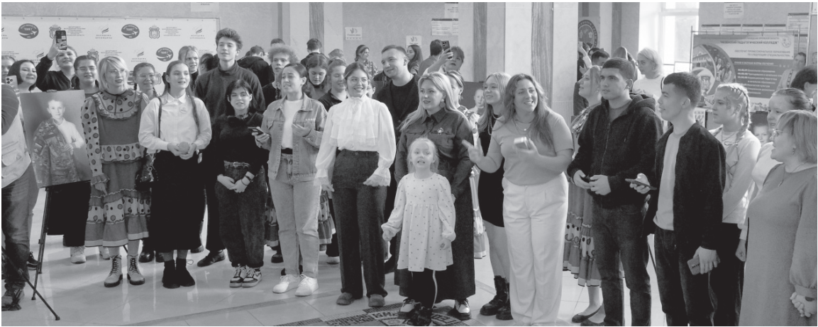
Участники форума вместе спели «Катюшу»