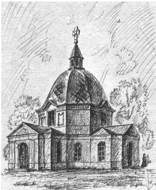
Борисоглебский храм, в котором крестили И.С. Тургенева (иллюстрация из книги «Архитектурные древности Орловщины (ушедшее)»).

Интервью подготовила Татьяна ПАВЛОВА. Фото Вячеслава МИТРОХИНА.