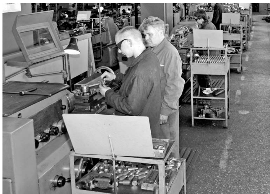
Практика в цехе — первый шаг к освоению профессии инженера