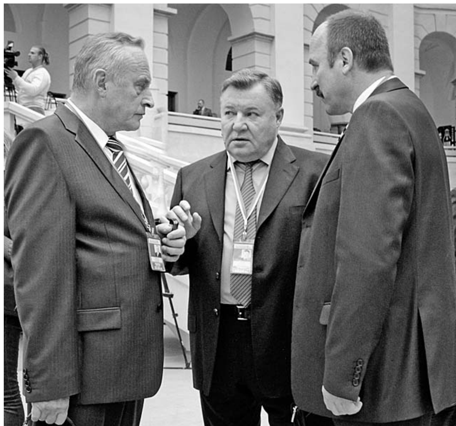
Губернатор Александр Козлов: — Я приглашен в секцию «Новая экономика», потому что мне есть что рассказать об экономическом росте Орловской области. Кроме того, я хотел бы выслушать мнение экспертов