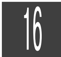
16 захоронений времен Великой Отечественной войны на территории Ильинского сельского поселения