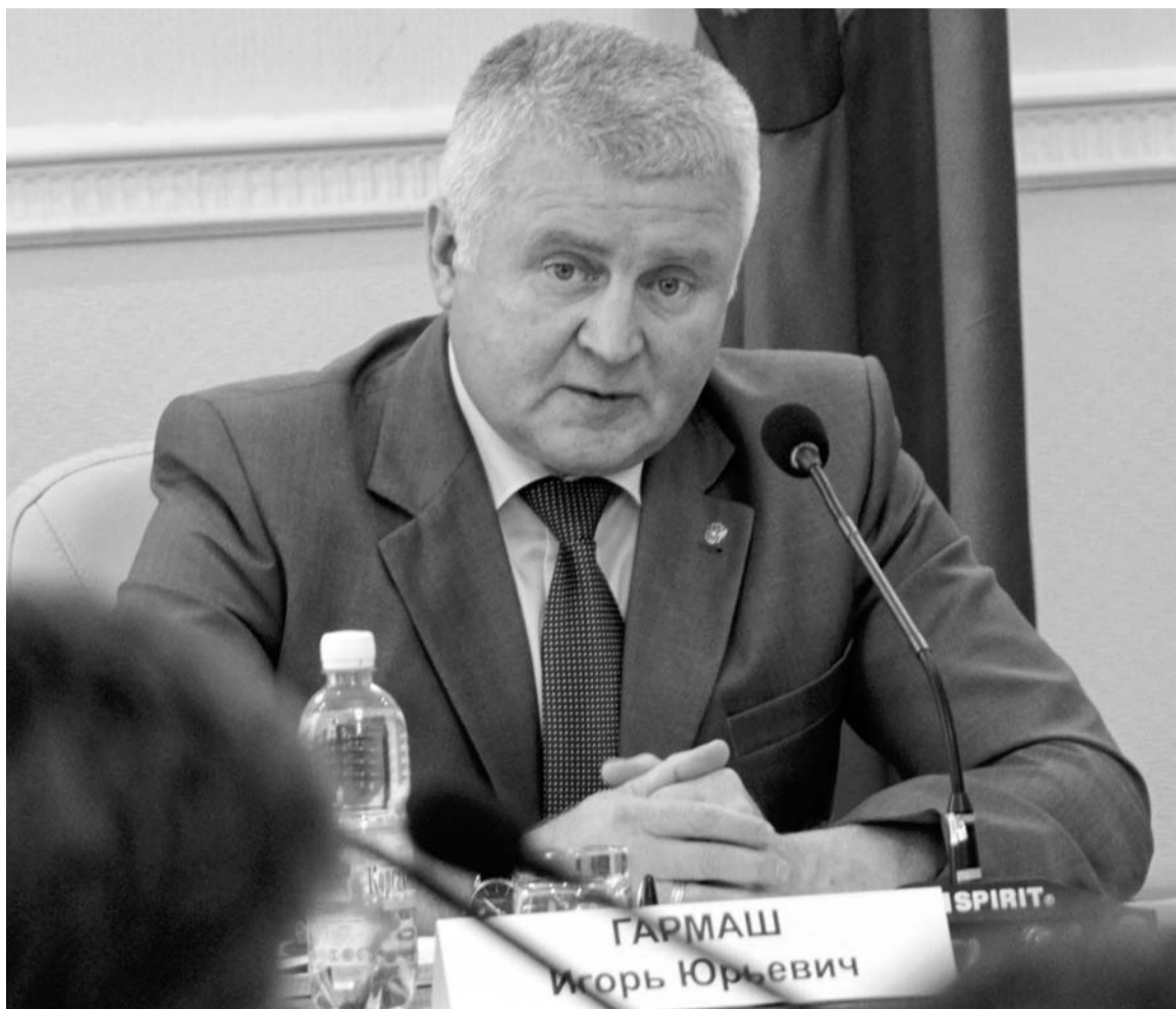
Заместитель губернатора Игорь Гармаш: — Со злом под названием наркомания, преступность мы должны бороться все вместе

КАМЕРЫ ВИДЕОНАБЛЮДЕНИЯ ПОМОГУТ ПРЕДОТВРАТИТЬ ПРЕСТУПЛЕНИЯ