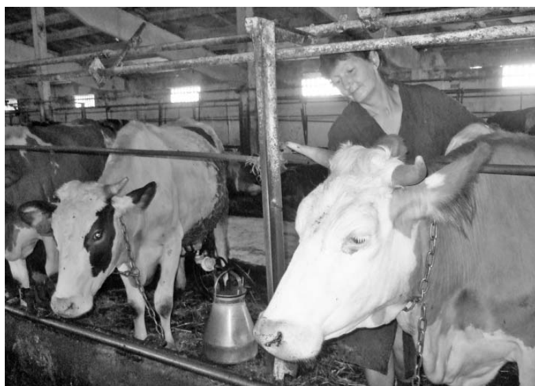
Животные на привязи только в цехе по раздоям.

— Считаю, что мы обеспечили прибавку продуктивности коров в первом полугодии во многом бла-