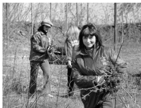
Дворянское гнездо, Козий парк, аллея Депутатов на набережной Дубровинского, памятник жертвам фашизма в Медведевском лесу. Активисты «Молодой гвардии единой России» взяли шефство над памятником танкистам в районе завода Химмаш.

В ходе санитарного дня общими усилиями были приведены в порядок воинские захоронения, парки, скверы, места отдыха горожан, стадионы. В стороне от общегородской уборки не остались члены и сторонники партии «Единая Россия» — к началу футбольного сезона они привели в порядок стадион имени Ленина. Были срублены старые деревья, убранны мусор, высажены новые деревья. Также были благоустроены