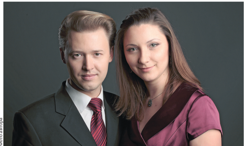
Молодые музыканты показали в Орле высокое мастерство

Далее было исполнено несколько миниатюр — жемчужин мировой классики. В них музыканты