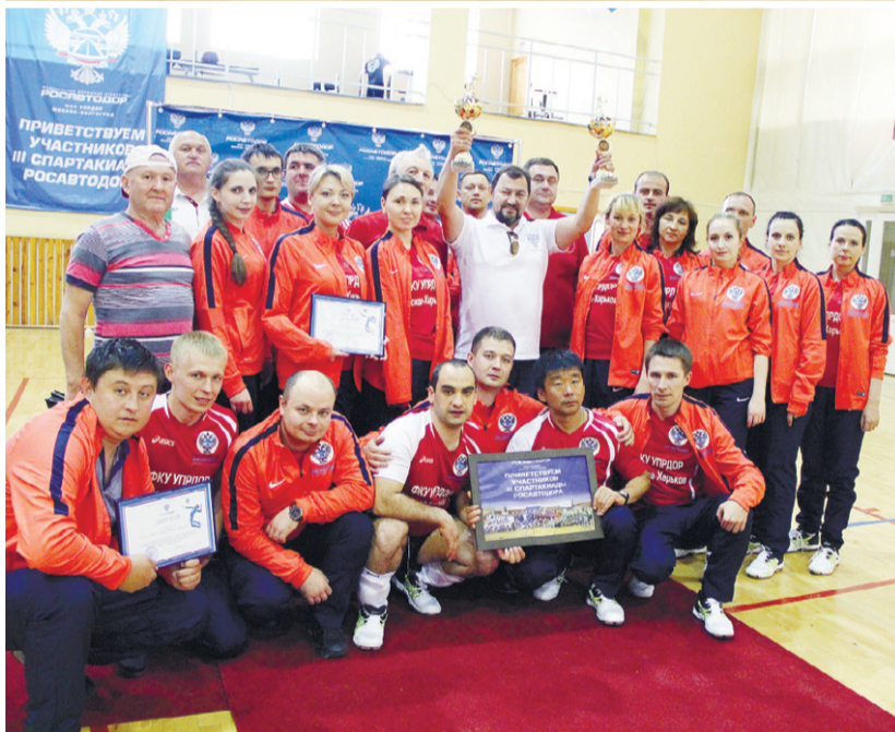
Сборная ФКУ Упрдор Москва — Харьков на III Спартакиаде среди работников подведомственных Федеральному дорожному агентству федеральных казённых учреждений