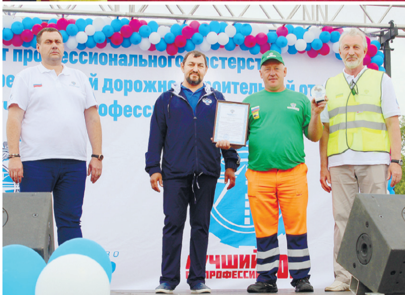
Призёры конкурса профмастерства «Лучший по профессии-2016»

томагистралей, повысить их пропускную способность, к минимуму свести какие-либо неудобства водителей и пассажиров, ну а самое главное — в значительной степени сократить количество ДТП. Современное, качественное, безопасные дороги — приоритет в повседневной работе наших специалистов. Наравне с этим мне хо-