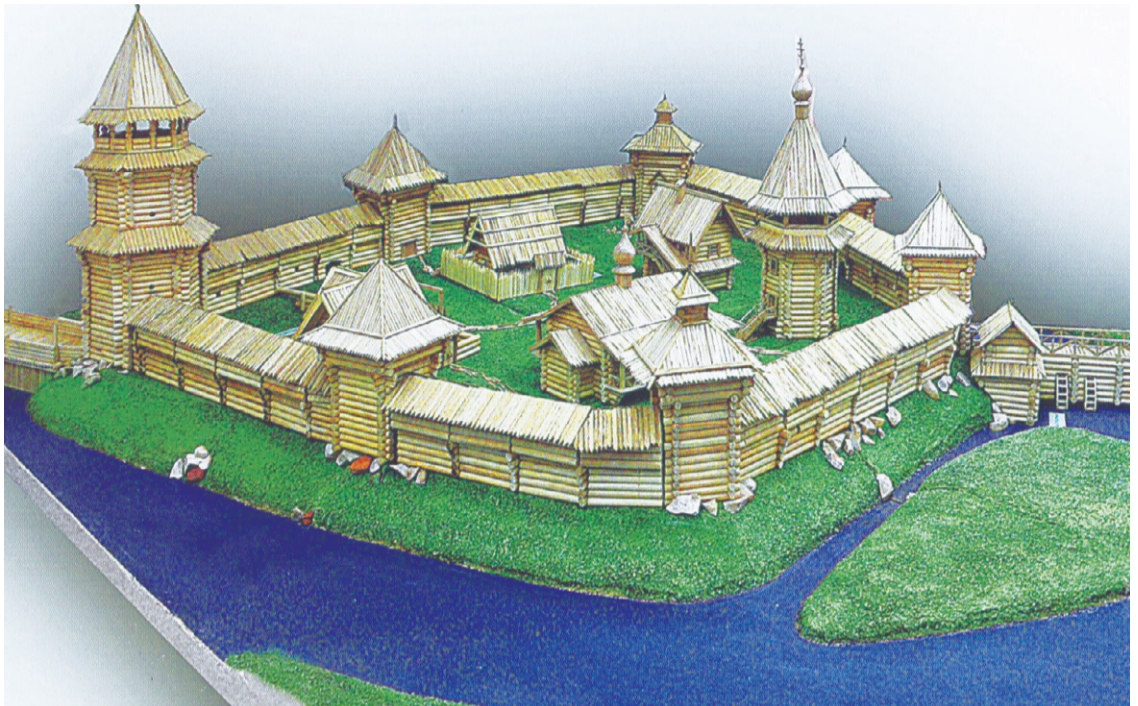
Макет первой крепости на слиянии рек Оки и Орлика