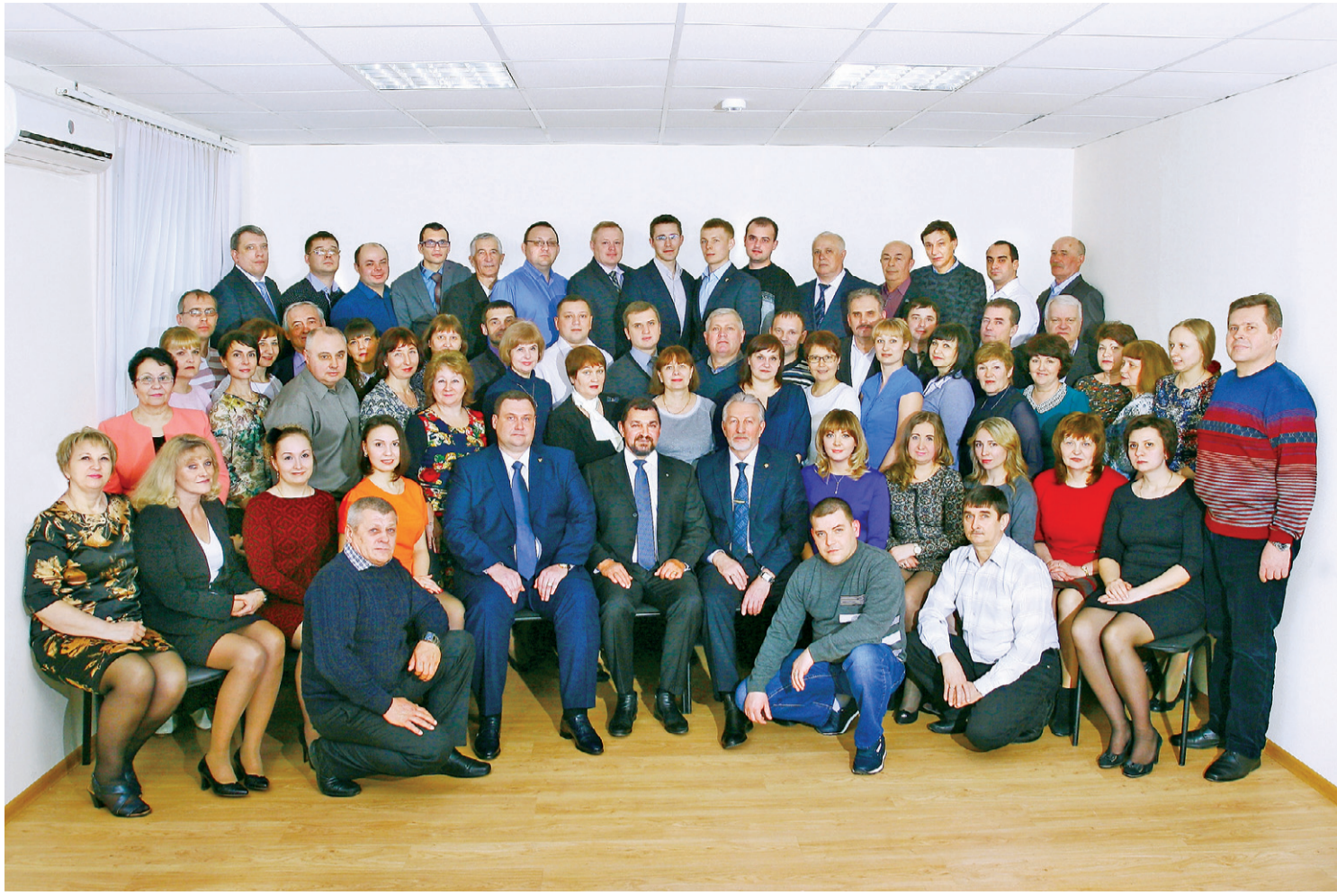
Дружный коллектив ФКУ Упрдор Москва — Харьков