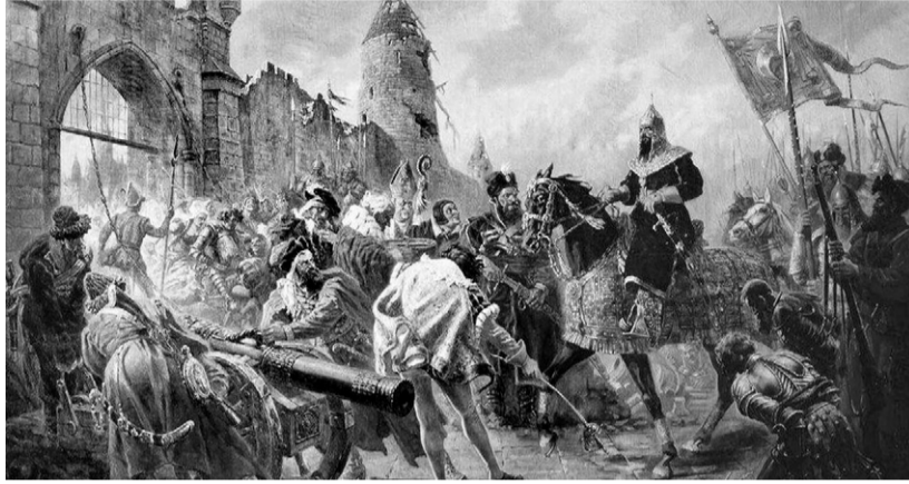
Взятие Иваном Грозным ливонской крепости Кокенгаузен

Для этой когорты деятелей фигура сильного русского царя, который ещё при жизни получил эпитет «Грозный», была, безусловно, как кость в горле — точно так же, как не устраивали европейских и российских либеральных историков ни Пётр I, ни Екатерина II, ни Николай I, ни Иосиф Сталин. Любой русский, российский или совет-