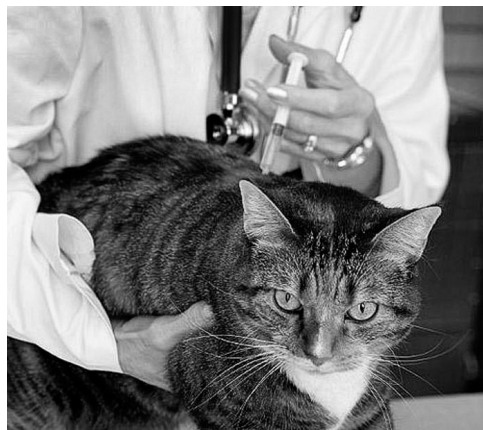
«Я уколов не боюсь»