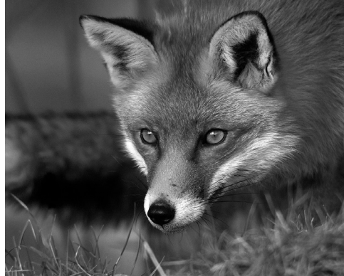
Лисица — опасная сестрица

— Помощь пострадавшим от укусов оказывается круглосуточно и бесплатно. В Орле пациентов принимают в трёх травматологических пунктах при городской больнице имени Боткина, при больнице скорой помощи имени Се-