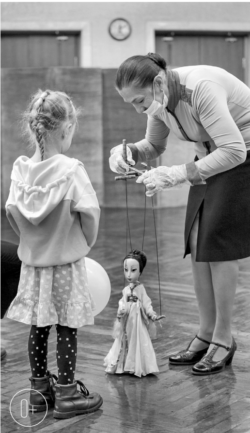
В руках мастеров театра куклы оживают