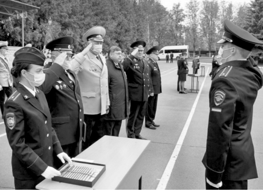
Курсантам желали успехов в учёбе и крепкого здоровья!