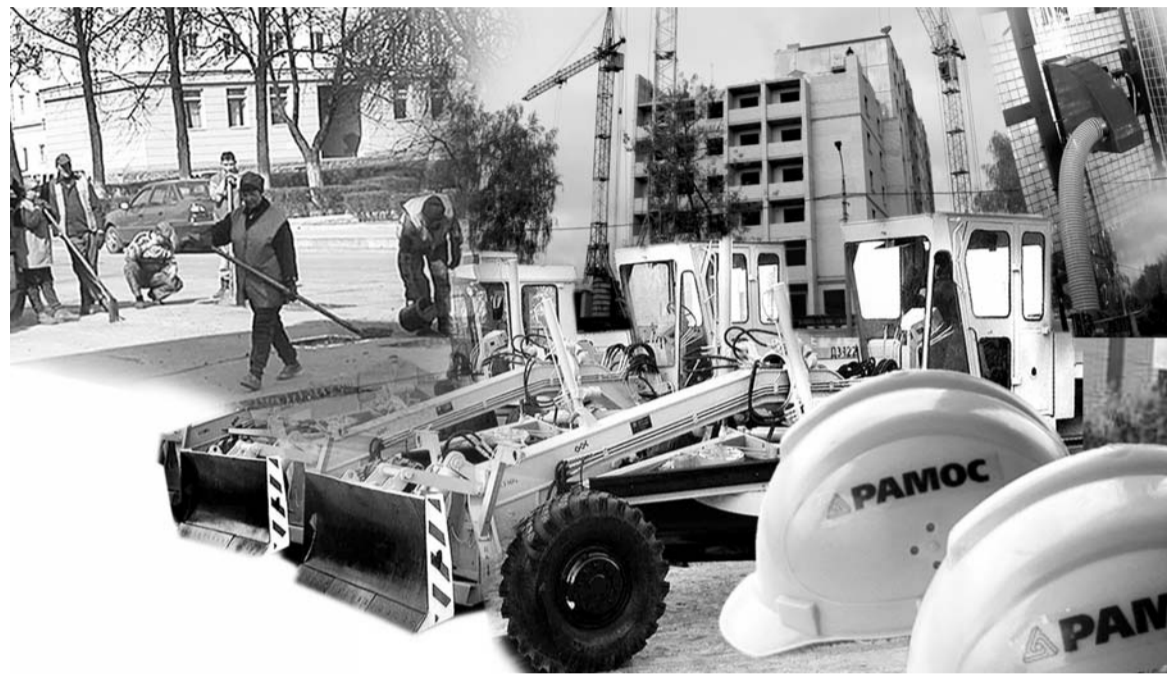
Ведено ни одного уголовного дела по смертельному случаю на производстве.

Однако проверка выявила в ЗАО "Дормаш" ряд нарушений норм и правил охраны труда. Численность пострадавших в расчете на тысячу работающих составила 8,6 и превысила среднеобластную