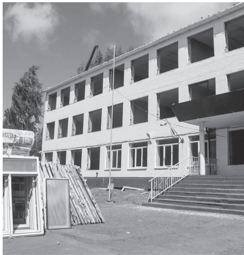
В орловских школах ведутся комплексные работы по обновлению фасадов, кровли, внутренних помещений

За каждым объектом капремонта школ закреплены депутаты от «Единой России» всех уровней, сенаторы. Они несут персональную ответственность за качество и сроки выполнения работ. Сергей Кравцов отметил, что такая система контроля доказала свою эф-