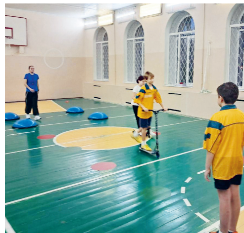
Двигайся больше — проживёшь дольше