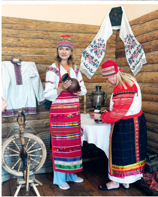
Усадьба Шеншиных: узнали историю и примерили наряды тех времён