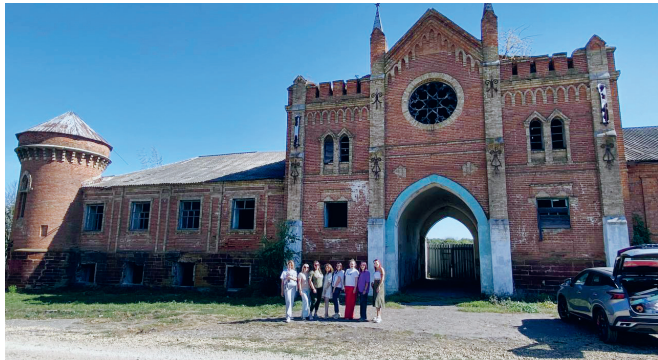
Замок генерала Охотникова

— Что вы! Наша библиотека — одна из старейших би-