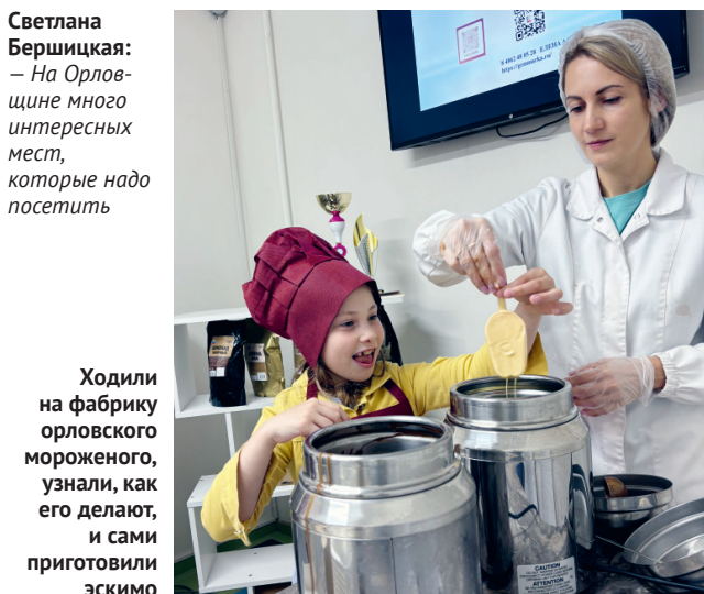
Ходили на фабрику орловского мороженого, узнали, как его делают, и сами приготовили эскиммо

лась случайно. Они пришли на экскурсию на телеканал «Первый областной» и «Экспресс радио Орёл».