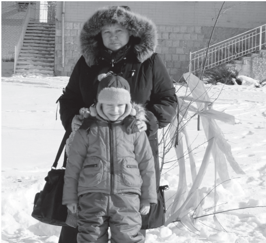
Бабушка с внуком около люка, в который он провалился