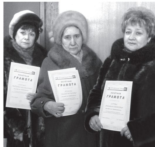
Наши помощники-киоскеры из Орла

Руководство «Орловского издательского дома» выражает признательность всем киоскерам и руководству ЗАО «Роспечать» за участие в распространении периодических печатных изданий среди населения Орловской области.