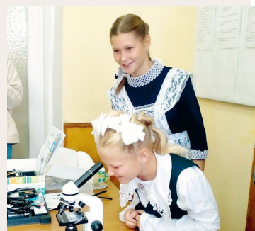
Школа новых возможностей