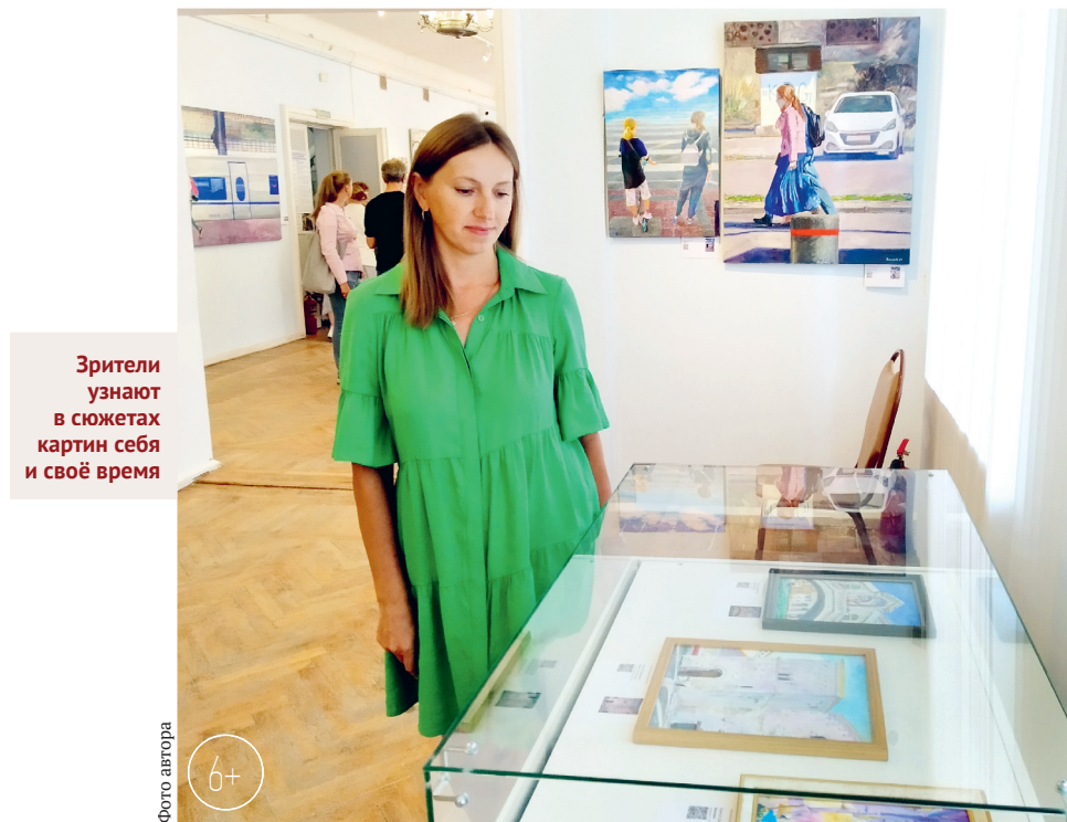
Зрители узнают в сюжетах картин себя и своё время