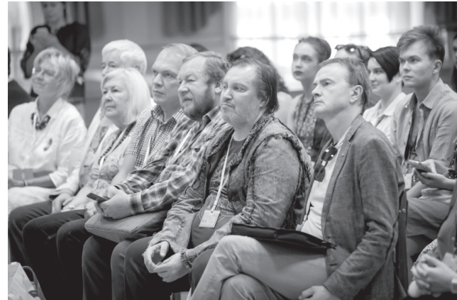
В первом ряду — руководители секций и мастер-классов

по праву признан Орёл, обойти никак не могли.