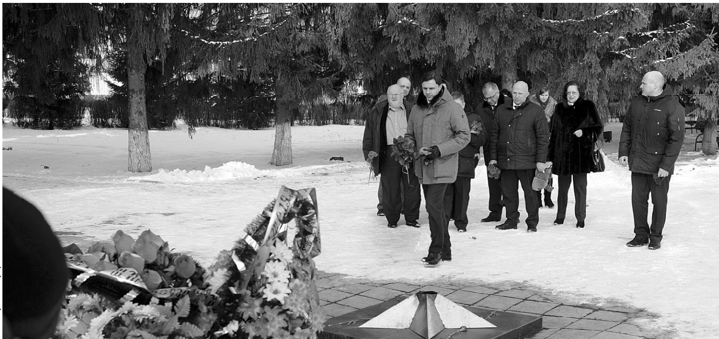
Никто не забыт

Осмотрев цехи, глава региона особо отметил, в какой чистоте находятся животные.