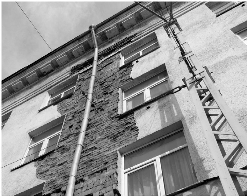
Капитальный ремонт, как стихийное бедствие?

— Мы хотим, чтобы собственники утверждали не итоговую смету, а ведомость дефектов, найденных при техническом обследовании, и ведомость работ,