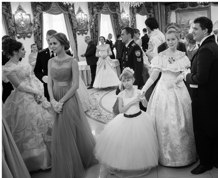
Время тургеневских девушек не прошло

Он открыл секрет: уже есть договорённость с правительством Первопрестольной о проведении дней Орловщины в Москве. 9 и 10 августа в столице пройдут круглые столы, творческие встречи, выставки больших фотографий, представляющих самые интересные и живописные места орловского края.