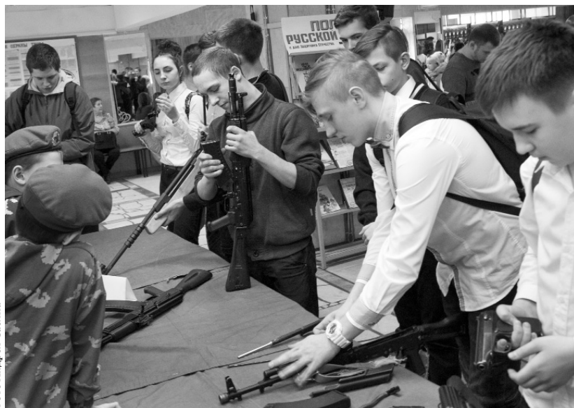
С мечтой служить в десанте

СПРАВКА Центр «Десантник» в Орле был создан по инициативе ветеранов боевых действий в горячих точках в 1997 г. для трудных подростков.