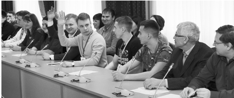
Победителей конкурса ждут лучшие российские компании

По словам главы региона, сегодня нужен новый