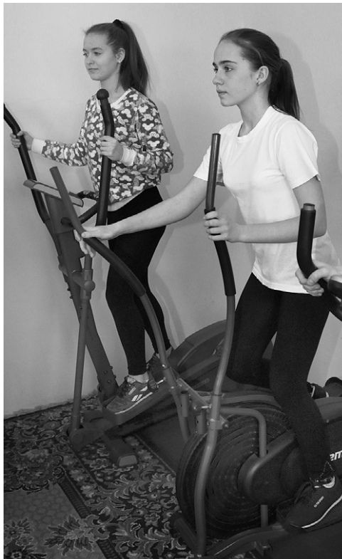
Центр дополнительного образования детей «Энергия» заряжает покровцев энергией

Позже он пообщался с местными жителями в ДК