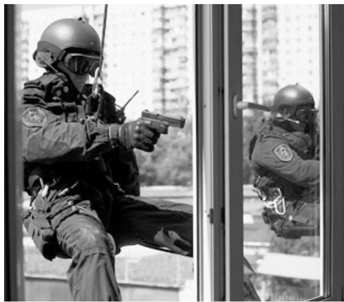
СОБР на высоте