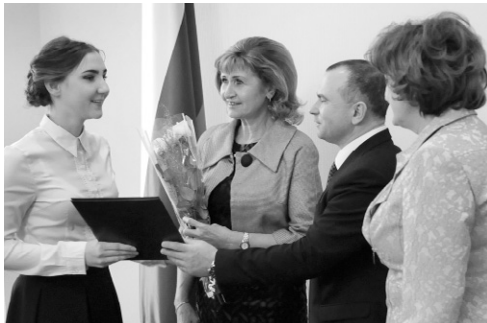
Поддержка талантливой молодёжи — работа на перспективу

— В этом году исполняется 200 лет со дня рождения классика мировой литературы, нашего знаменитого земляка, человека, благодаря которому русское художественное слово зазвучало в Европе, — сказал Роман. —