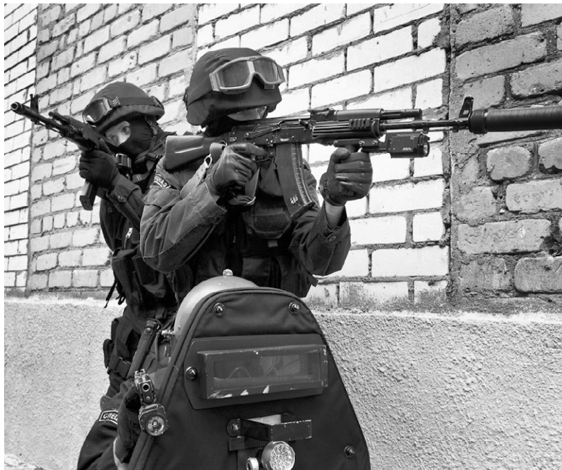
Задание будет выполнено!

— Ну и расскажи про один такой обычный рабочий день! — настаиваю я.