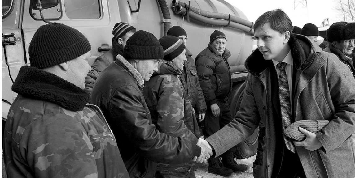
Как живёте, мужики?

Специализация филиала — производство продукции растениеводства. В структуре севооборота с 2012 года преобладают