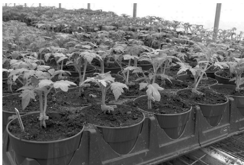
Хорошая рассада — залог богатого урожая

Итак, почву для посева семян я заготавливаю ещё с осени. Беру как можно более рыхлую, богатую гумусом, чтобы она хорошо пропускала воздух и не покрывалась коркой после полива. Мешаю её с промытым речным песком и, при необходимости, с качественным покупным грунтом (по одной части каждого компонента). Полученный почвогрунт обеззараживаю иногда прогревом в духовке, но чаще всего прямо в ёмкостях для рассады, проливая его