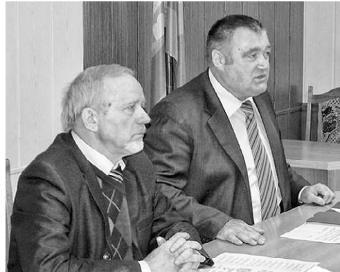
Начальник УМВД России по Орловской области Юрий Савенков отметил, что органы правопорядка ждут помощи от общественности в таком сложном и важном деле, как борьба с коррупцией

— Мы открыты для всех журналистов, тесно сотрудничаем с ними, а в качестве примера могу сказать: после проведения прямой линии в «Орловской правде» в этом году было возбуждено два уголовных дела в экономи-