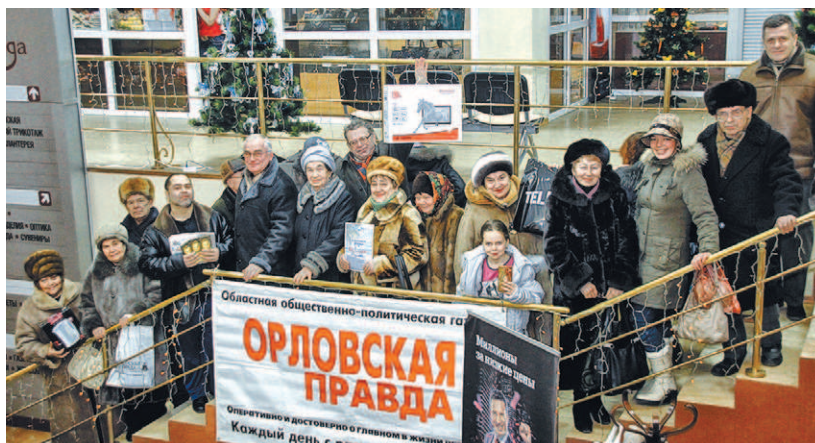
Обладатели призов от «Орловской правды» счастливы получить подарки от любимой газеты под Новый год