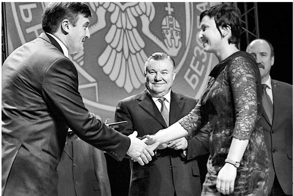
Начальник УФСБ России по Орловской области Виктор Задворный: — Самые теплые слова благодарности — всем нашим сотрудникам!

ГУБЕРНАТОР ПОЗДРАВИЛ СОТРУДНИКОВ УФСБ С ЮБИЛЕЕМ