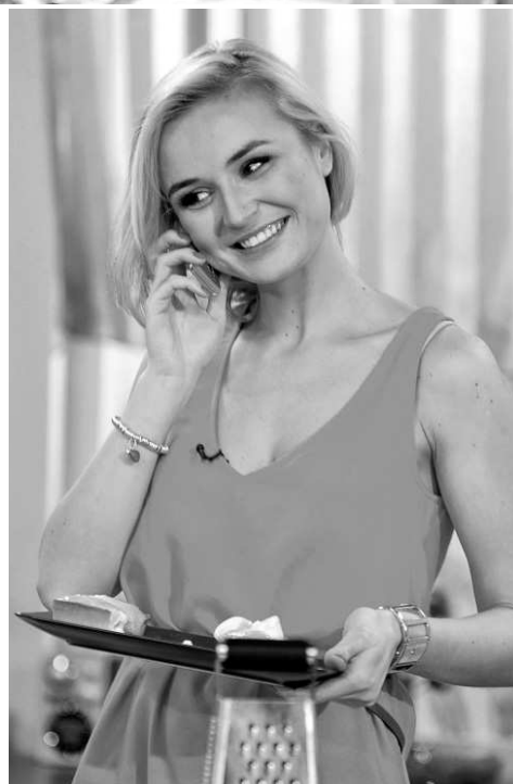
Полина Гагарина: — Я настоящий кофеман: могу пить кофе 15 раз в день!

— Положительно. В Таиланде люблю есть фрукты, даже пробовала дури-