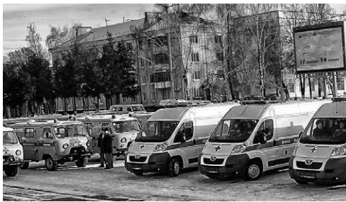
Уже завтра эти машины поедут по городским и сельским дорогам — спасать людей

рублей израсходовано на новые машины скорой помощи