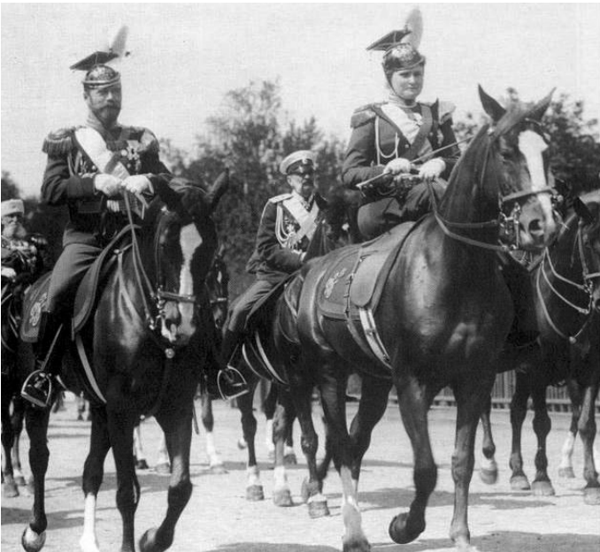
Императорская чета Романовых на полковом празднике в Петергофе