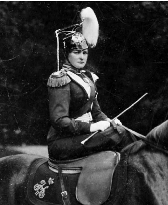
Её Величество Государыня Императрица Александра Фёдоровна

ранен, служил денщиком в особом отделе, демобилизовался в 45-м из Кёнигсберга. Наша семья осталась в оккупированном Орле. Когда пришедшие к нам на постой немецкие офицеры увидели на стене портрет отца в военной форме, то пришли в бешенство, приняв его за советского офицера. Один из них схватил мою мать-бронетку за волосы и свирепе кричал: «Юдде (еврейка)?!!» Дело могло кончиться очень плохо. Но, как мать потом вспоминала, ей будто сам бог подсказал произнести: «Нет-нет, этот офицер царя Николая». Так потом немцы всегда говорили приходящим к ним в гости другим гитлеровцам: «Вот матка, вот что её спасло...» — и показывали на портрет юного улана Её Величества.