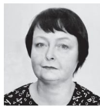
России Владимира Владимировича Путина.

Я, как и миллионы россиян, поддерживаю политику нашей страны и судьбоносные решения Президента