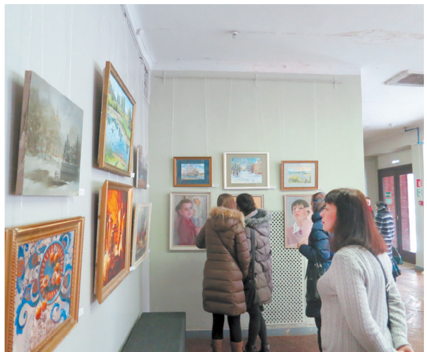
«Женская выставка» всегда интересна зрителям