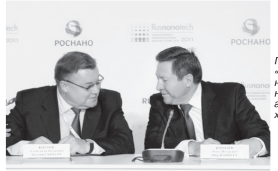
Проект «РОСНАНО» на Орловщине носит социальный характер

Губернатор Орловской области подписал соглашение о сотрудничестве между Правительством Орловской области и ОАО «РОСНАНО».