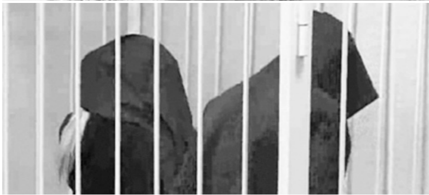
Подсудимые предпочитали не светиться перед телекамерами

ных рядов марксистов-ленинцев оказались «чуждые классовые элементы». Представители же «иконниковского крыла» по-молодежному советуют старейшинам «не париться», объясняя, что время идет вперед, а коммерция вытесняет идеологию. Да и рабочие с крестьянами вкупе с пенсионерами никак не возьмут в толк, каким образом олигарх будет бороться за их права? Может, поставками проститутки? Может, и так. Но в таком случае КПРФ надо как-то сопрягать с сексом,