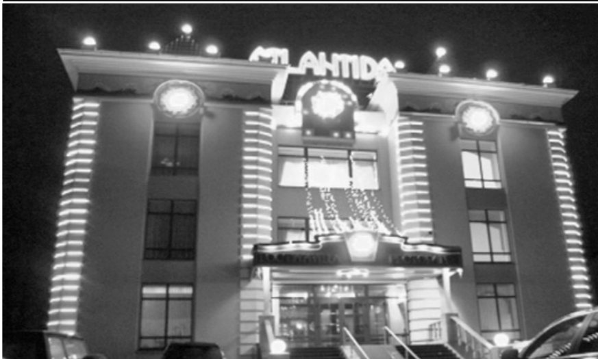
Не то гостиница, не то бордель, а всё в одном флаконе