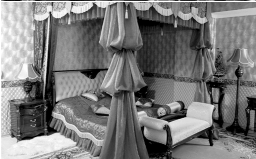
Нужно как минимум две камеры, чтобы происходящее на ложе любви было видно как на ладони