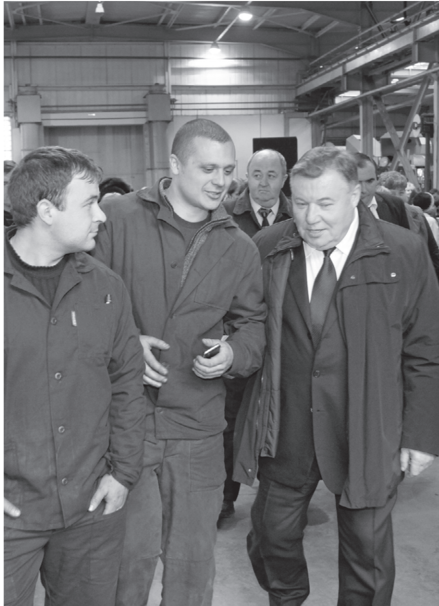
Рабочие делятся своими проблемами с главой региона

рублей — выручка с продукции Мценского литейного завода за девять месяцев 2011 года. Темп роста к аналогичному периоду 2010-го составил 131 процент