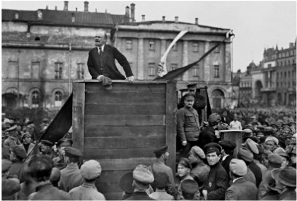
Октябрь 1917-го: мифы и реальность