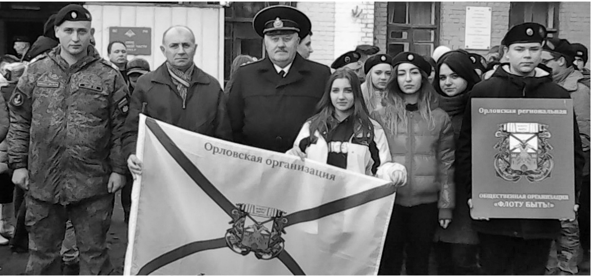
У ПИТЕРСКИХ МОРПЕХОВ