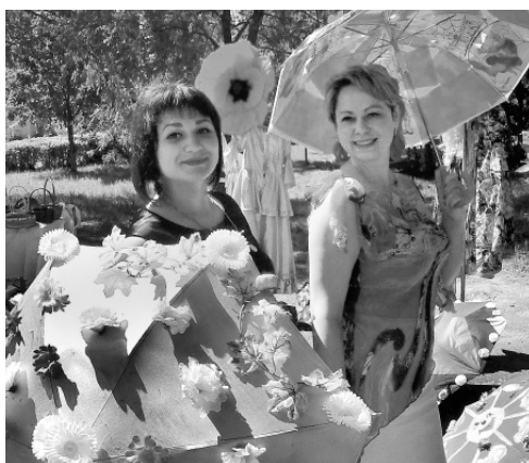
День района. Конкурс зонтиков