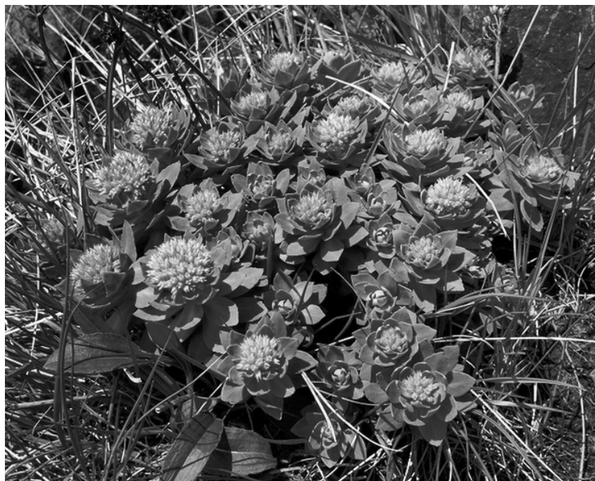
Родиола розовая — растение-лекарь

«Розовой» назвали этот вид родиолы за слабый запах розового масла, исходящего из разрезанного и подвяленного корневища. А золотым корнем называют из-за чешуек золотистого цвета, которым покрыто корневище. При этом родиола розовая не только красивое, но и целебное растение, обладающее уникальными тонизирующими свойствами.