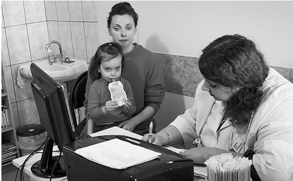
Маленькая пациентка не боится врача

Детям микрорайона Зареченский больше не придётся томиться в ожидании приёма врача в стеснённых условиях