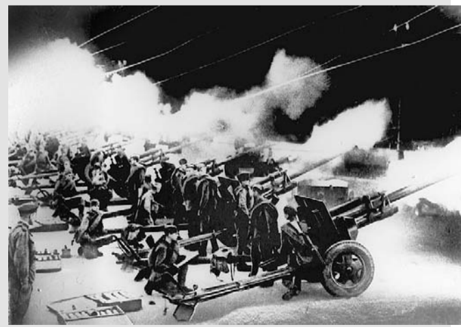
Елена ГУСЕВА.