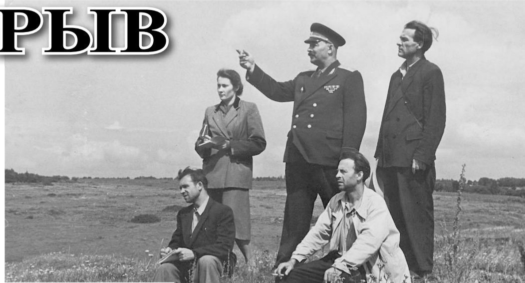
Генерал А. Ф. Кустов с художниками и музейными работниками на местах бывших боёв.

Именно эти люди и пригласили в музей материалы по теме, помогли разработать тематическое задание, написать научные справки о ходе операции, соб-