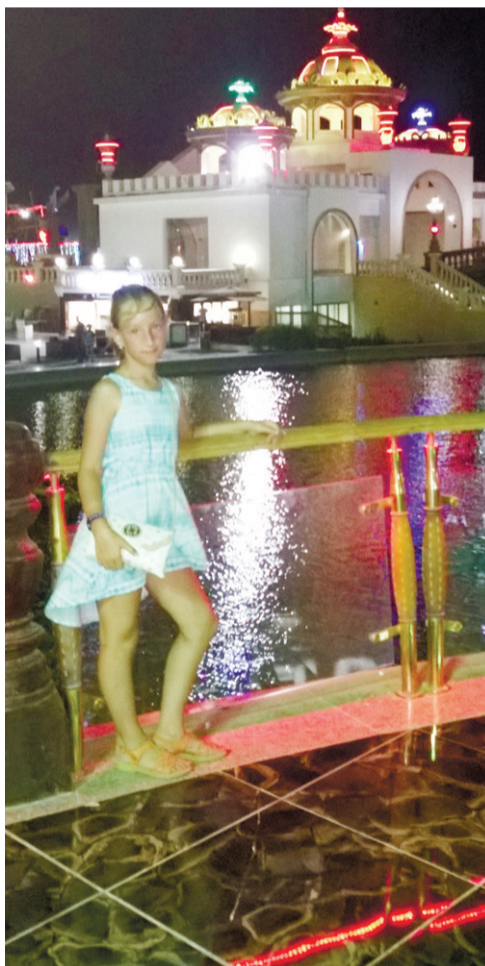
На вечерней экскурсии в парке «Голливуд»

«Русские названия торговых точек в Шарм-эль-Шейхе попадают на каждом шагу. Видели даже такую надпись на нашем великом и могучем: «Здесь русский дух, здесь Русью пахнет...».