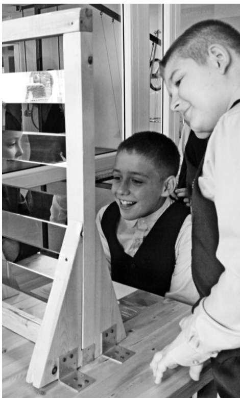
Что там в зазеркалье?

«В «Экспериментарии» на простых примерах и с помощью интересных экспериментов можно легко и весело изучать многие законы физики, математики, химии, астрономии.»