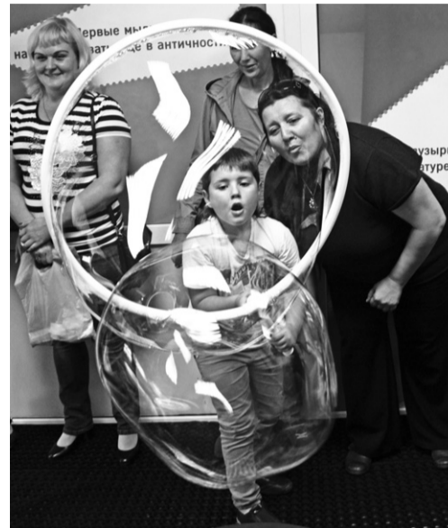
Таких гигантских мыльных пузырей ещё не видели!

Девчонок можно понять: они не ожидали, что скучные и сложные задачи и теоремы по точным