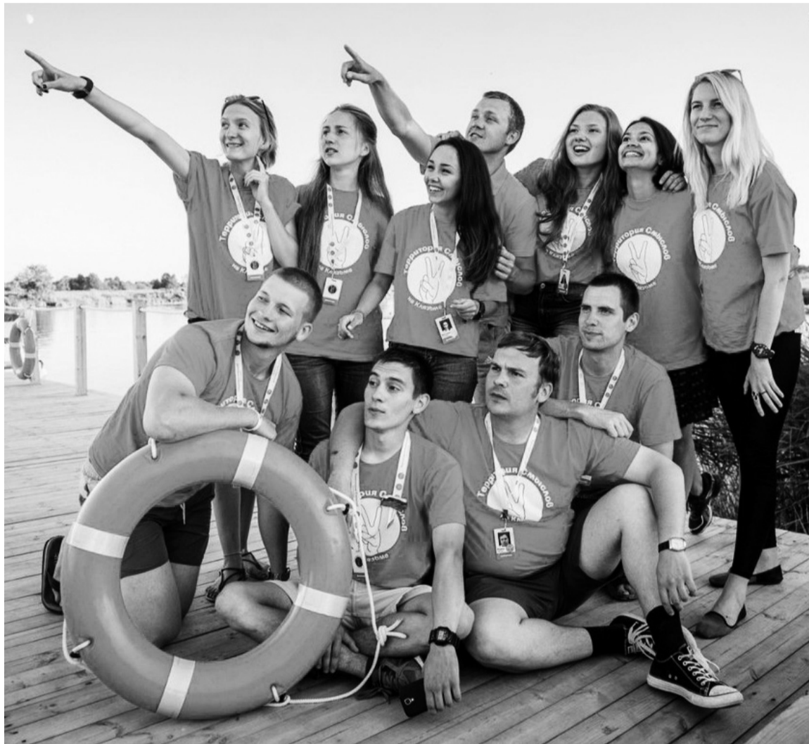
У орловских волонтеров впереди ещё столько добрых дел!

В развлекательном комплексе «Версаль» прошла акция «Лето добрых дел»