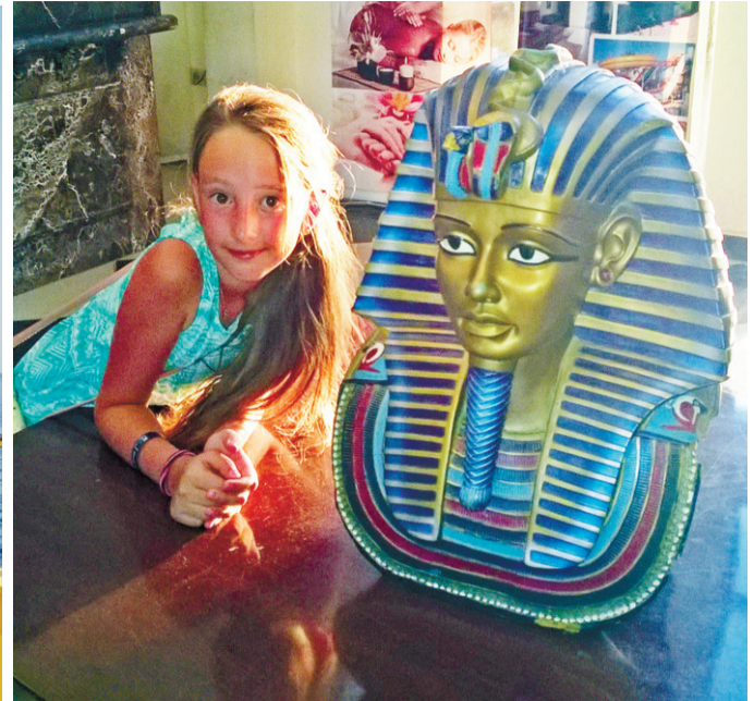
В сувенирной лавке