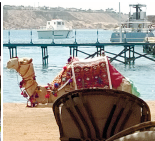
Верблюд готов прокатить русских туристов